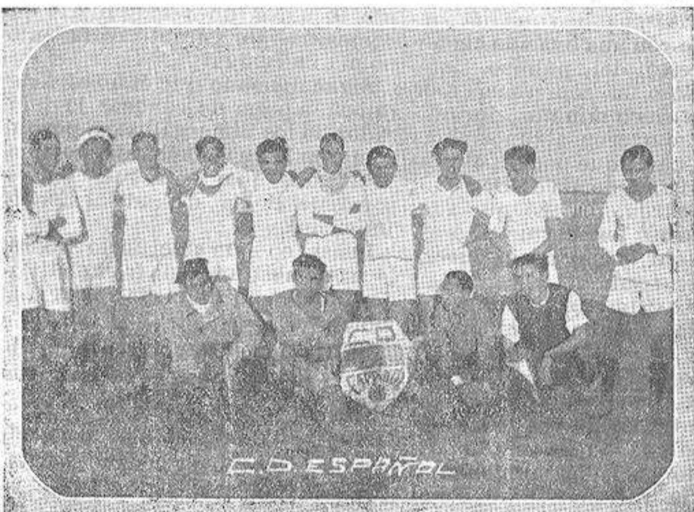
El once del C. D. Español, formado por valiosos elementos, que en el Torneo «Copa Alicante 1935» esta obteniendo brillantes resultados

Por último en reñidísimo mach el Imperial vence al Marina.