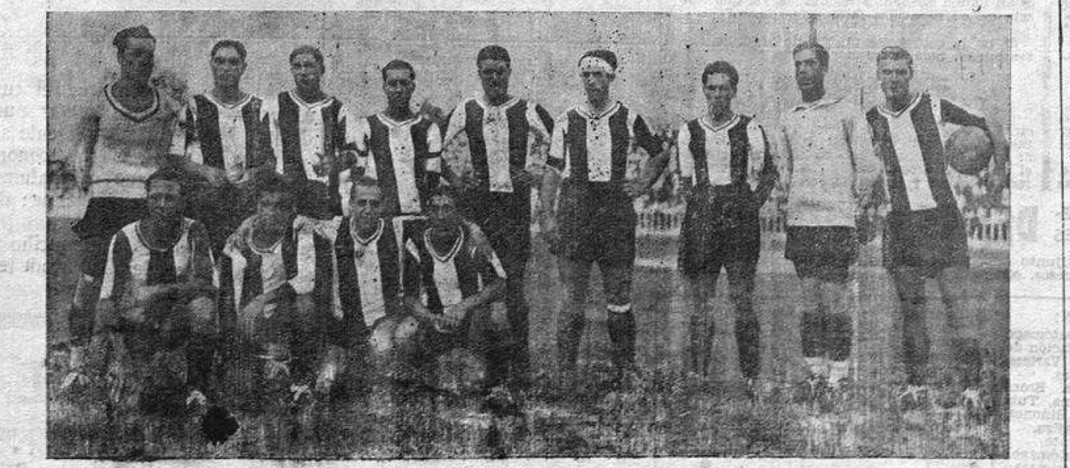
Nuestro campeón regional que mañana en «Altavix» se enfrentará, con su eterno rival el Elche F. C.

Salida el 24 de septiembre 180 pesetas todo pagado INSCRIPCIONES Casa SANCHEZ