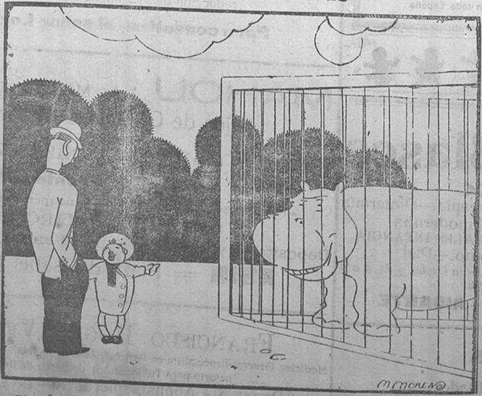
EL NIÑO ANTOJADIZO.—¡Papá! ¡Cómprame ese juguete!

to Claudi en Méndez varias pl 1928 es icamos.