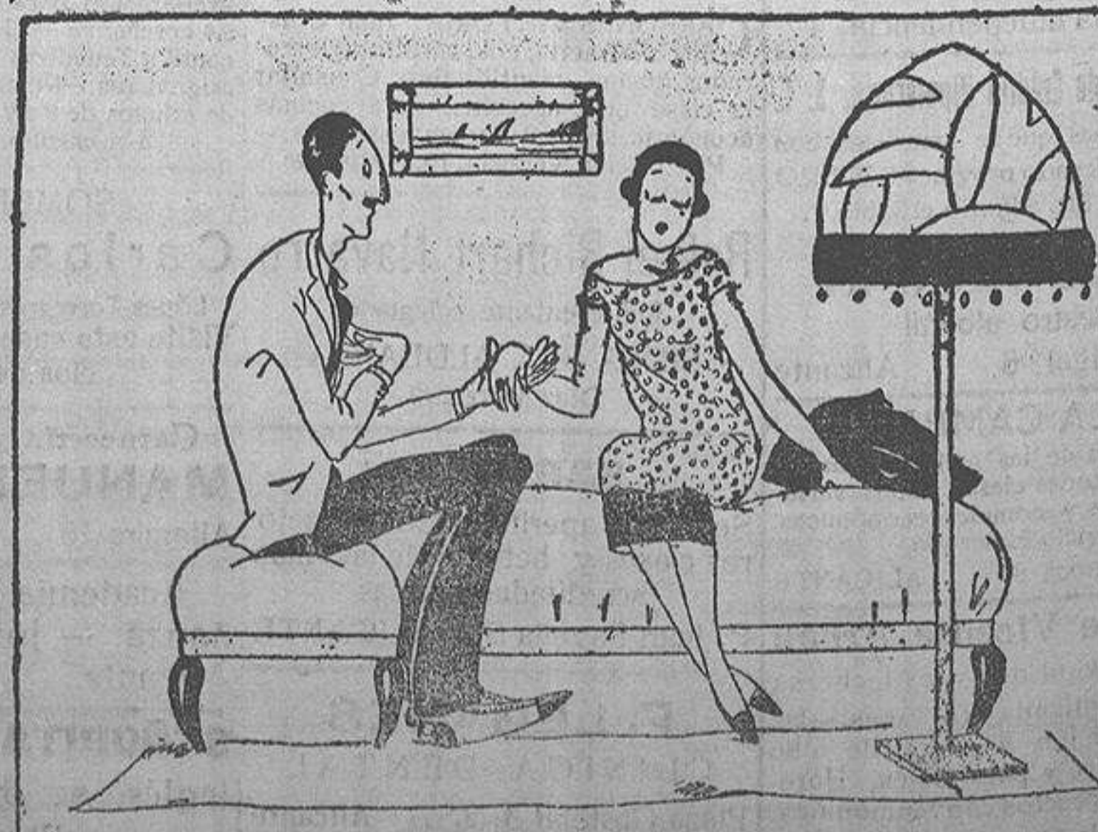
—Asiento, ¿estos juramentos de amor que me haces ahora, no los olvidarás algún día? —Hija mía, de eso no te respondo. En mi familia tenemos todos muy poca memoria.