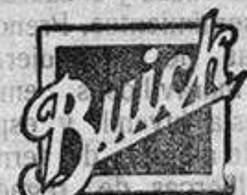
Fabricado por General Motors

GENERAL MOTORS PENINSULAR, S. A. Nueva fábrica: Granada 35.-Madrid