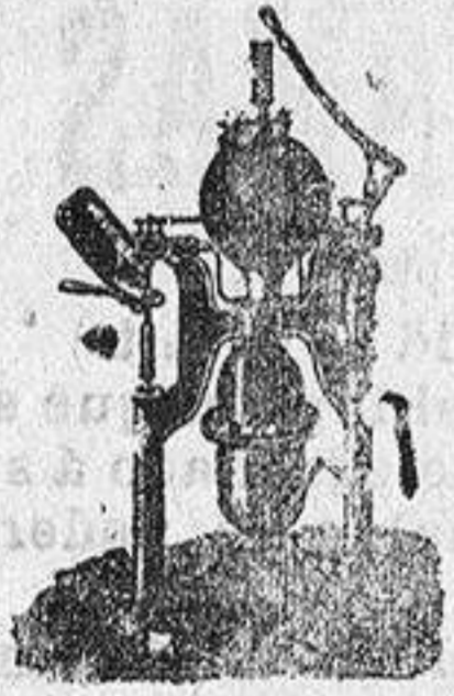
Máquina para hacer gaseosas

DESPACHO | DEPÓSITO Alcalá, 52 | Barrio de Salamanca MADRID