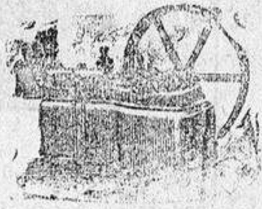
Máquina de vapor locomotiva

Catálogos gratis y francos á quien los pida.