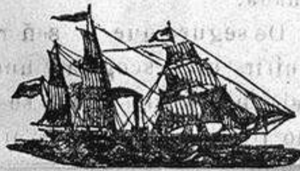
El vapor correo español de la