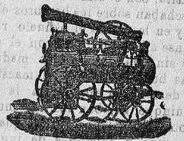
Máquina de vapor locomóvil