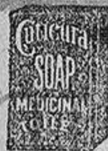
Reduct. Copia Exacta.

Y por una sola aplicación de CUTICURA, el gran remedio para la piel y el más puro emoliente, siendo esto el más puro, pronto y económico tratamiento para curar torturas, desfiguraciones, comezones, escamas, crostas y barros de la piel así como los humores del casco con pérdida del cabello: Es recomendado por los mejores médicos y farmacéuticos del mundo.