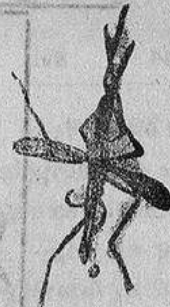
ANOFELE Mosquito que propaga la fiebre palúdica

Rogamos á los señores Doctores, que lo ensayen en los casos que resultaron incurables con cualquier otro tratamiento, con la seguridad de que después no lo abandonarán nunca.