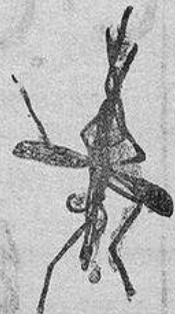
ANOFELE Mosquito que propaga la fiebre palúdica