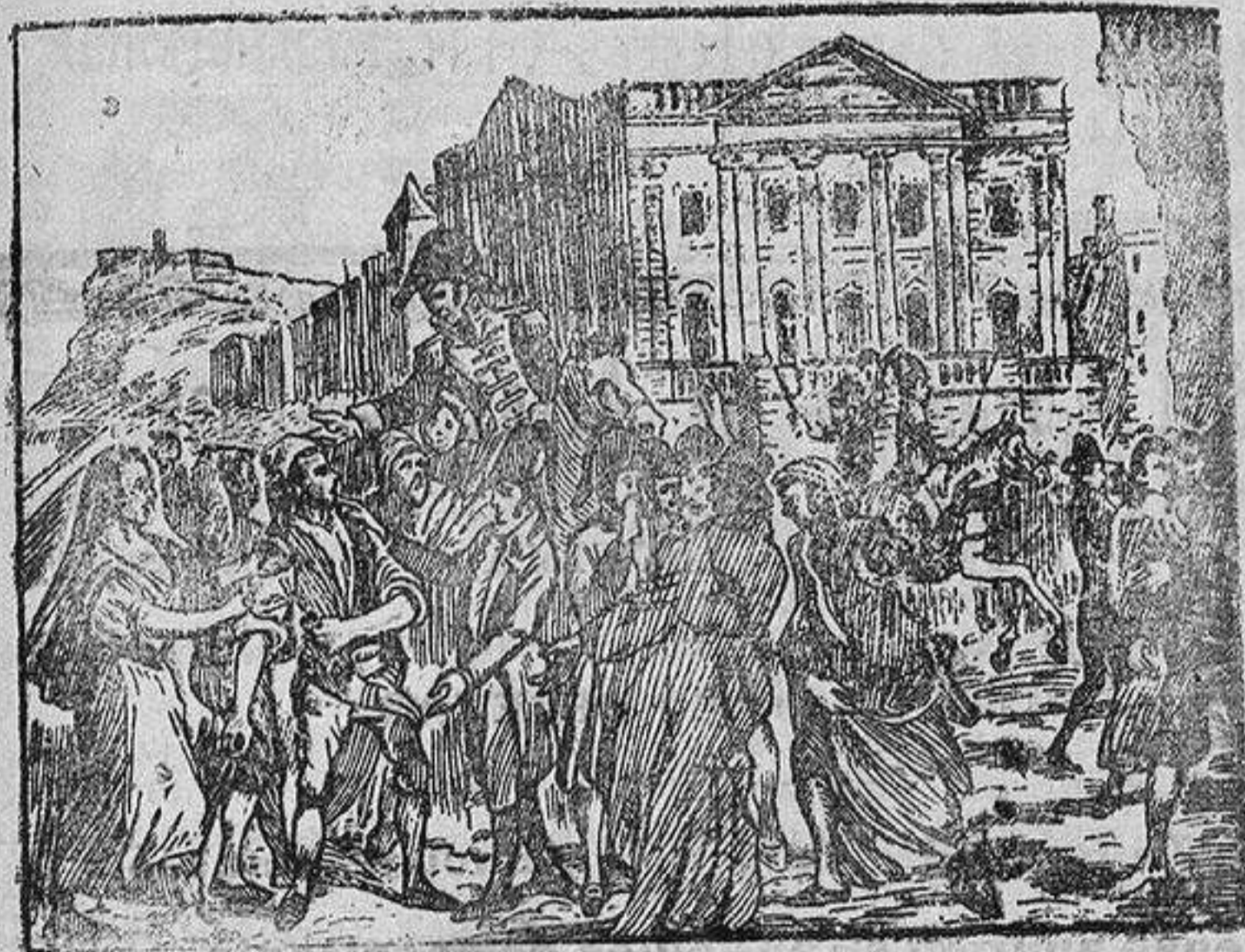
Excitación popular en Barcelona el día 10 de Marzo de 1808 con motivo de la ocupación de Montjuich por los franceses.