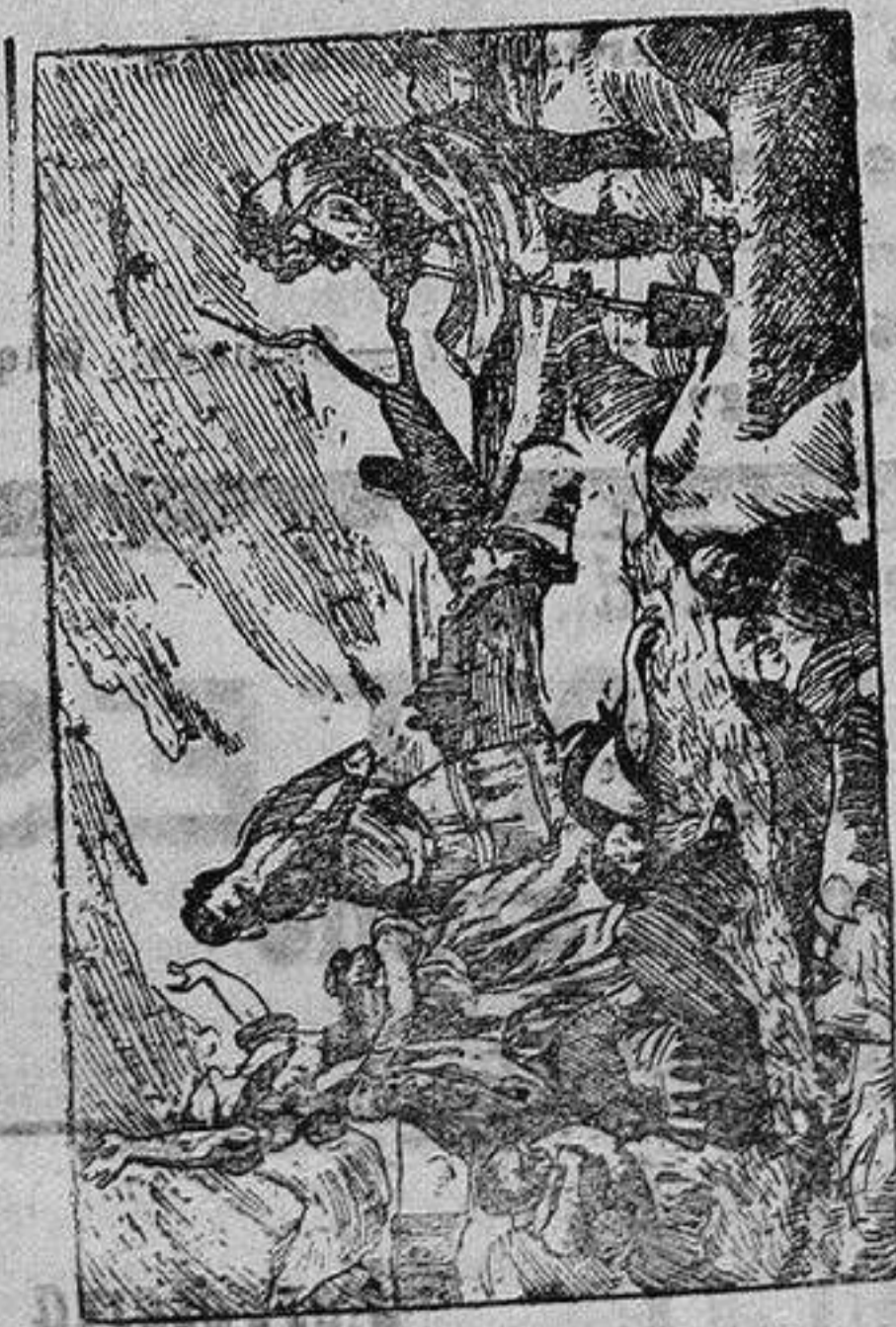
El 3 de Mayo de 1808 (Cuadro de V. Palmaroli).