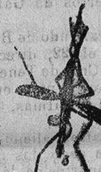
ANOFELE Mosquito que propaga la fiebre palúdica

Regamos á los señores Doctores, que le ensayen en los casos que resultaron incurables con cualquier otro tratamiento, con la seguridad de que después no le abandonarán nunca.