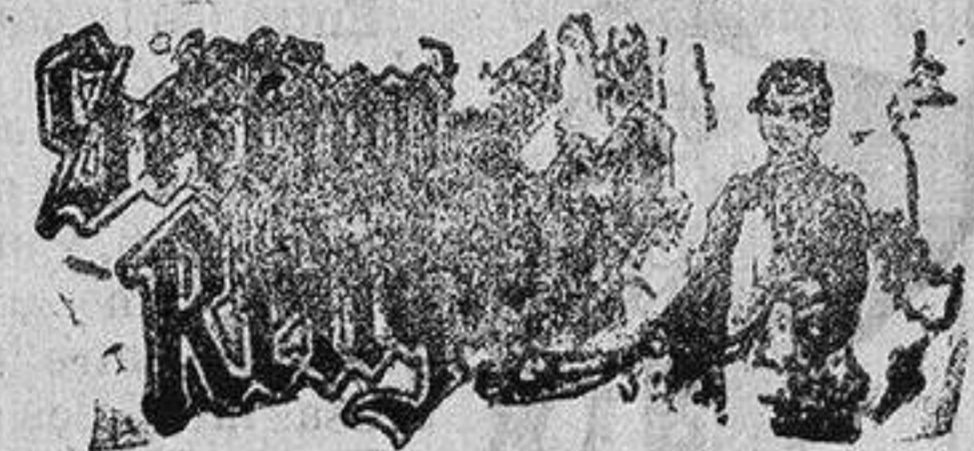
Santo de hoy: San Hilario Santo de mañana: San Pablo

Para caballero hay un gran surtido en cortes de traje y pantalones, última creación, como también en abrigos, tanto en pieza, como confeccionados.