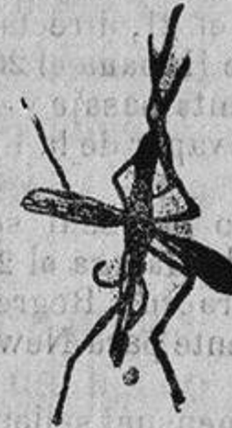
Mosquito que propaga la fiebre palúdica