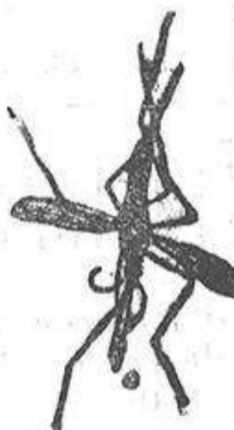
Mosquito que propaga la fiebre palúdica