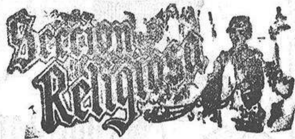
Santada hoy: San Pedro Santo de mañana: San Capasio

Han dado principio los populares «Viernes» y «Sábado», con saldos, retales y gangas á la cuarta parte de su valor.