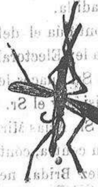
ANOFELE Mosquito que propaga la fiebre palúdica

Rogamos a los señores Doctores, que lo ensayen en los casos que resultaran incurables con cualquier otro tratamiento, con la seguridad de que después no lo abandonarán nunca.