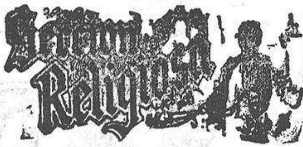
Santo de hoy: Nuestra Señora de la Luz Santo de mañana: San Marcellino

Sin duda alguna, la gran colección de muselinas de lanas bordadas, crespones seda, vestidos de gasa y tul bordados, nupis, fantasías, batistas, etc., etc., recibidas en la primera remesa de géneros en el popular establecimiento de tejidos EL SIGLO, es la que sobresa de las importadas en esta plaza, tanto por la abundancia de piezas y precios baratísimos, como por el gusto tan exquisito con que han sido elegidas.