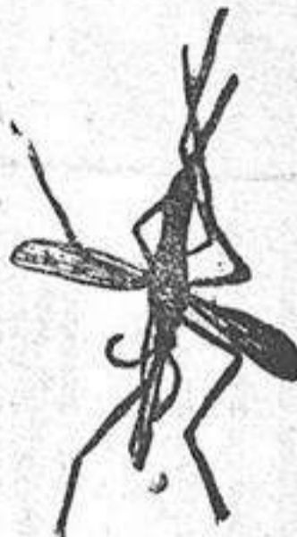
ANOFELE Mosquito que propaga la fiebre palúdica

Dosis preventiva y reconstituyente: 2 píldoras diarias.