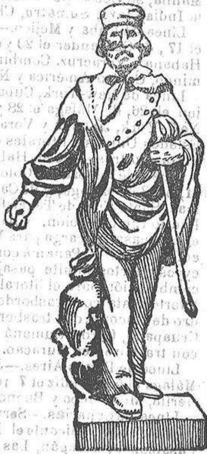
Estátua de Garibaldi

Damos nuestro más sentido pésame á la familia del niño tan querido, y que Dios los dé resignación bastante para soportar tan sensible desgracia.