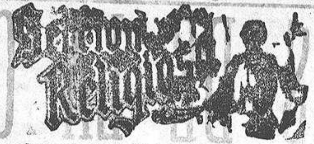
Santo de hoy: San Pablo. Santo de mañana: San Marcelo.

Para abrigos de señora, trajes bordados, blusas punto y piqué fantasías selectas, lanas de todas clases, faldas de barro, boas, nubes fantasía, etc., etc., visítense EL SIGLO, que es, sin duda, la casa que más barato vende, más surtido presenta y más gusto tiene en la elección de los géneros.