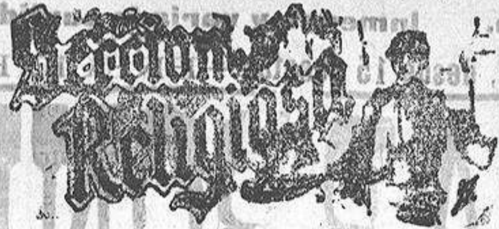
Santo de hoy: San Clemente. Santo de mañana: Santa Flora

Para abrigos de señora, trajes bordados, blusas punto y piqué, fantasías selectas, lanas de todas clases, faldas de barro, bois, nubes fantasía, etc., etc., visítense EL SIGLO , que es, sin duda, la casa que más barato vende, más surtido presenta y más gusto tiene en la elección de los géneros.