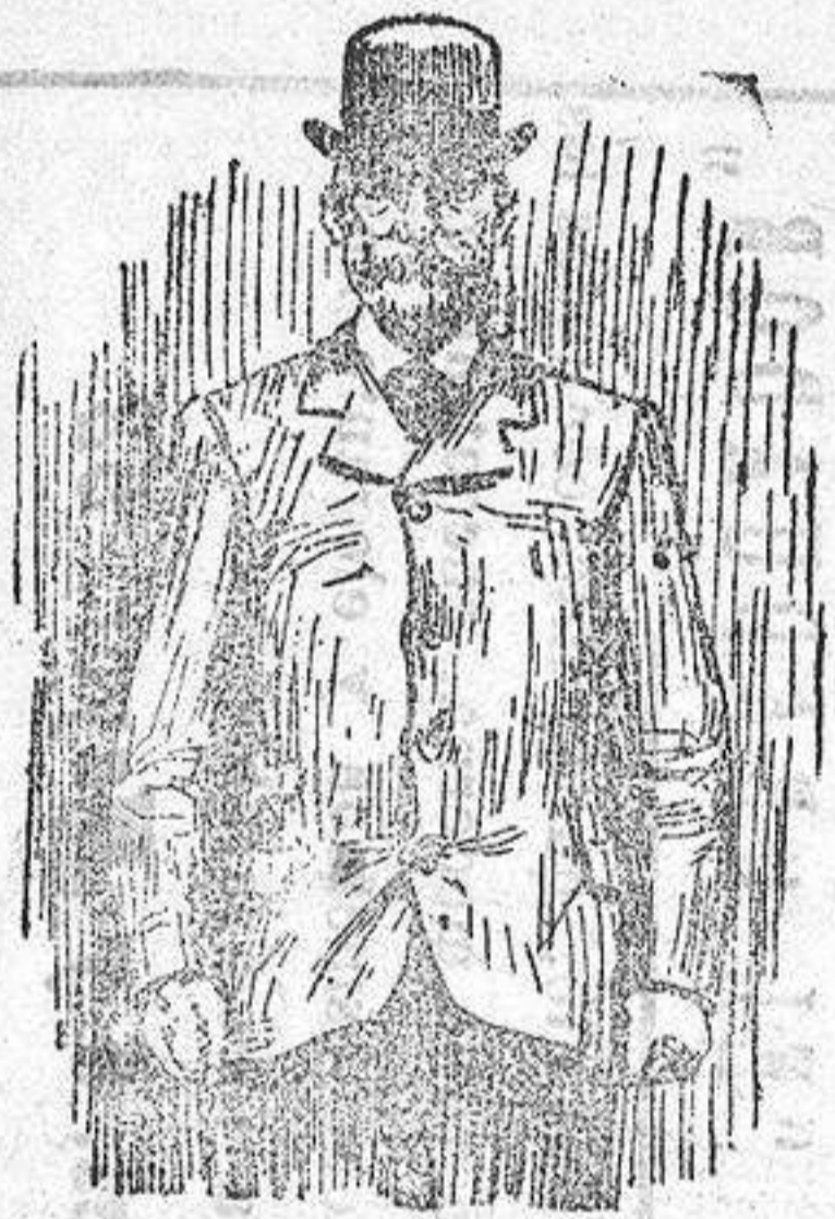
MR. JOHN BURN

Pocos políticos habrán ascendido tan rápidamente como aquel, cuyo retrato presentamos. Obrero mecánico, presentó hace un año su candidatura, siendo elegido diputado por Londres, y sin dejar de asistir a las sesiones de Cámara no abandonaba su rudo trabajo en el taller donde ganaba su sustento. Repentinamente, cosas del azar, al ocurrir una crisis, hace poco tiempo, fué llamado para ocupar el cargo de ministro de Trabajos públicos en el nuevo gabinete inglés, siendo la primera vez que tal ocurre en aquella nación.