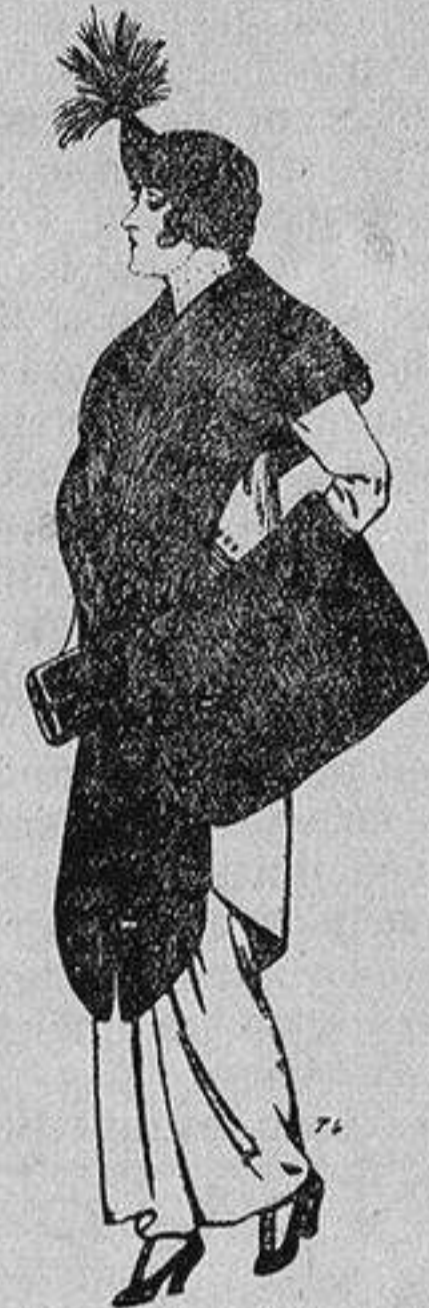
Juego de pieles de loutre de Nord para Señora 145 ptas.

SECCIONES: Peletería, Camisería, Géneros de Punto, Corbatería, Guantería, Sombrerería, Zapatería, Paraguas, Bastones y Artículos de Viaje.