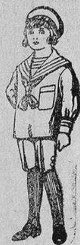
Trajes de jerga azul bordado oro en la manga para niños de 4 a 9 años De 20 a 22 ptas.

Ropas confeccionadas para Caballero, Señora, Niño y Niña