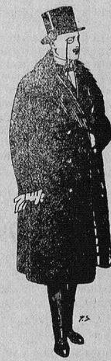
Gabanes de edredón negro, forro seda, cuello y vistas de piel a 125 ptas.