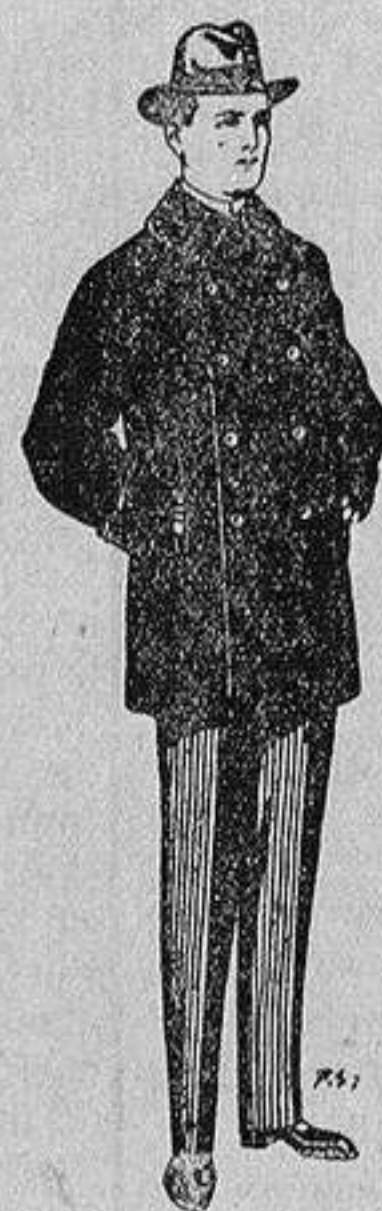
Pellizas con cuello y bocamangas de astrakan De 11 a 40 ptas