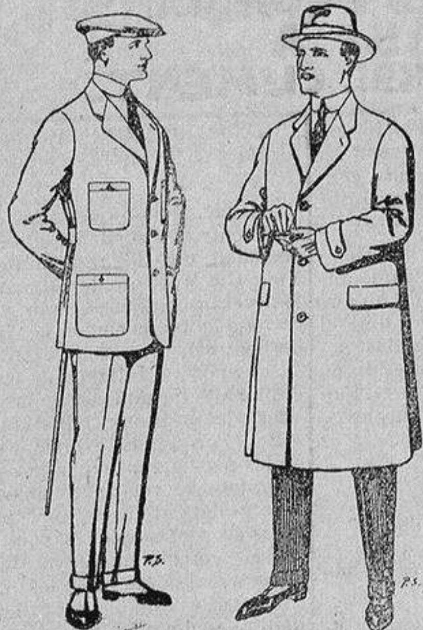
Trajes de cheviot, corte elegante para «Sportmen» De 45 a 55 ptas.

Madrid, Barcelona, Alicante, Almería, Bilbao, Cádiz, Cartagena, Gijón, Granada, Málaga, Palma de Mallorca, Santander, Sevilla, Valencia, Valladolid y Zaragoza