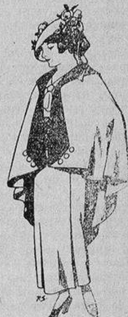
Capas de lana par jovencitas de 13 a 16 años A 25 pesetas