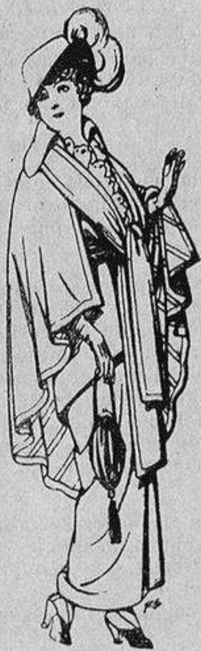
Capas de lana para señora A 20 ptas.