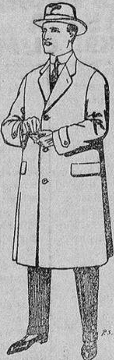
Gabanes de tejidos pluma satina, etc. De 17'50 a 70 ptas.