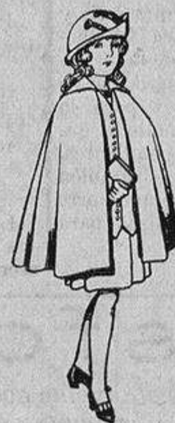
Capas de lana para niñas de 4 a 12 años De 20 a 22 pta s.