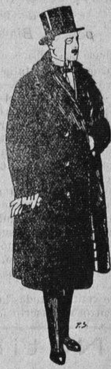
Gabanes de edredón negro, forro seda, cuello y vistas de piel a 125 ptas.