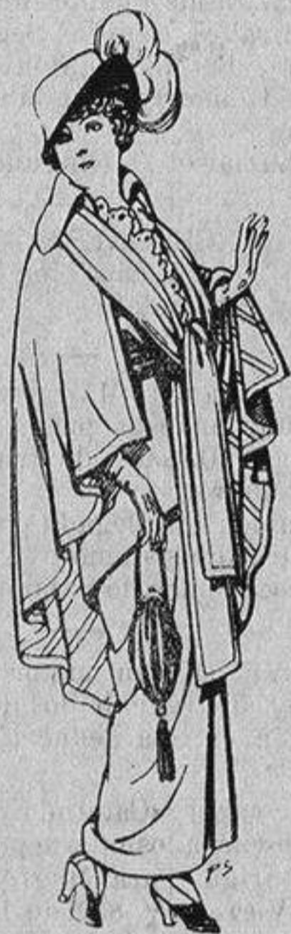
Capas de lana para señora A 20 ptas.