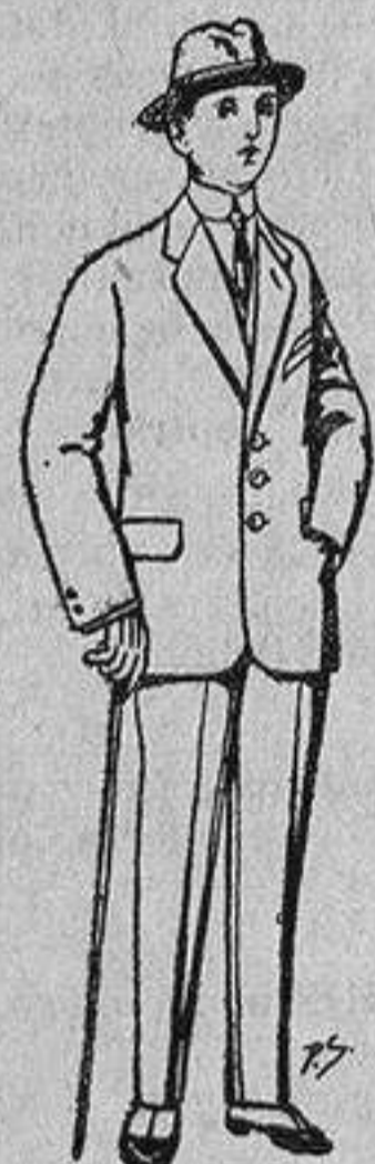
Trajes de paten, vicuña, etc., para niños de 10 a 16 años De 13 a 48 ptas.