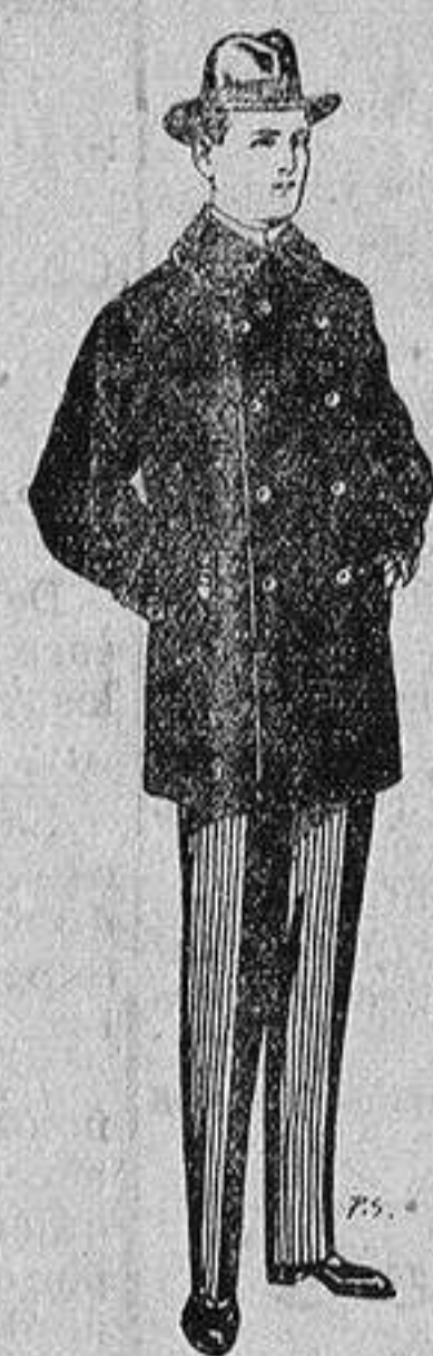
Pellizas con cuello y bocamangas de astrakan De 11 a 40 ptas

SECCIONES: Peletería, Camisería, Géneros de Punto, Corbatería, Guantería, Sombrerería, Zapatería, Paraguas, Bastones y Artículos de Viaje.