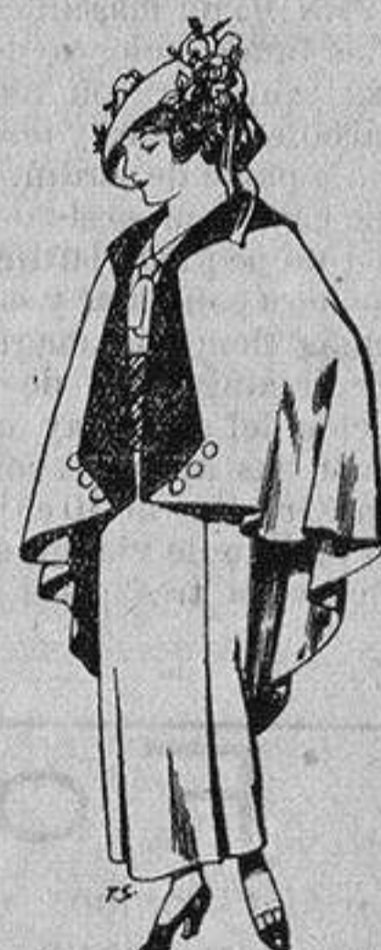
Capas de lana para jovencitas de 13 a 16 años A 25 pesetas