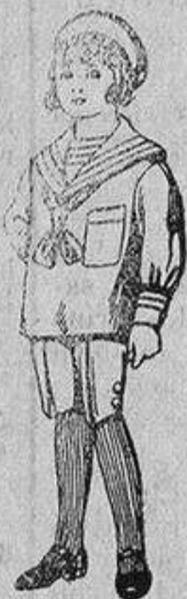
Trajes de jerga azul bordado oro en la manga para niños de 4 a 9 años De 20 a 22 pts

Ropas confeccionadas para Caballero, Señora, Niño y Niña