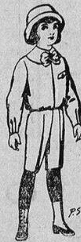
Trajes patén para niños de 4 a 9 años De 5 a 5'50 ptas.

SECCIONES: Peletería, Camisería, Géneros de Punto, Corbatería, Guantería, Sombrerería, Zapatería, Paraguas, Bastones y Artículos de Viaje.