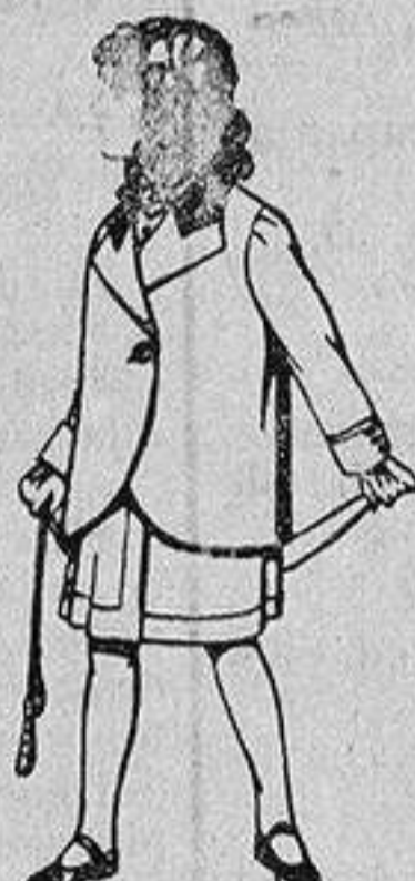
Trajes de lanilla para niños de 4 a 12 años De 14 a 22 ptas.

Ropas confeccionadas para Caballero, Señora, Niño y Niña