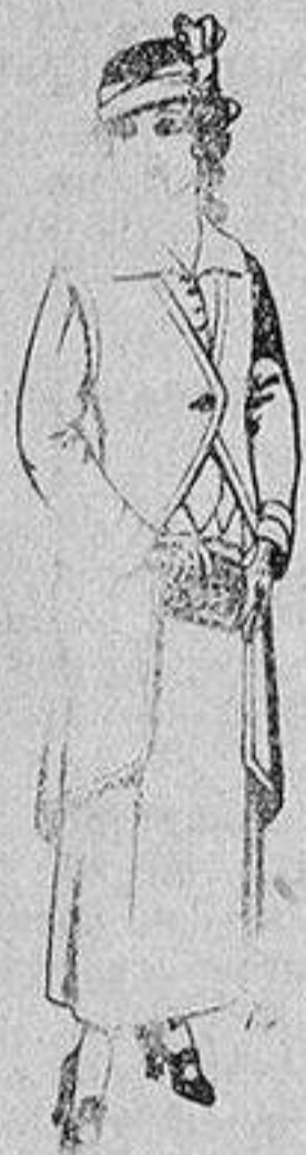
Trajes de lanilla para jovencitas de 13 a 16 años De 40 a 45 ptas.