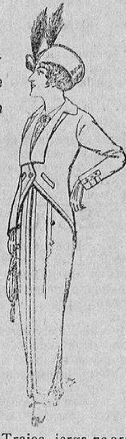
Trajes jerga negra para Señora 65 ptas.