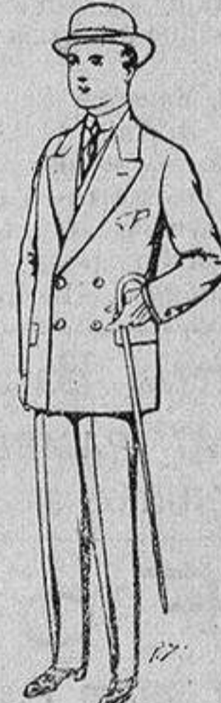
Trajes de patén, vicuña etc., para niños de 10 a 16 años De 25 a 48 pesetas.