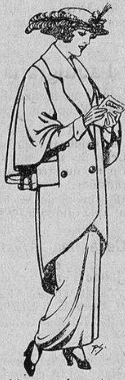
Abrigos de patén para Señora De 55 a 65 ptas.