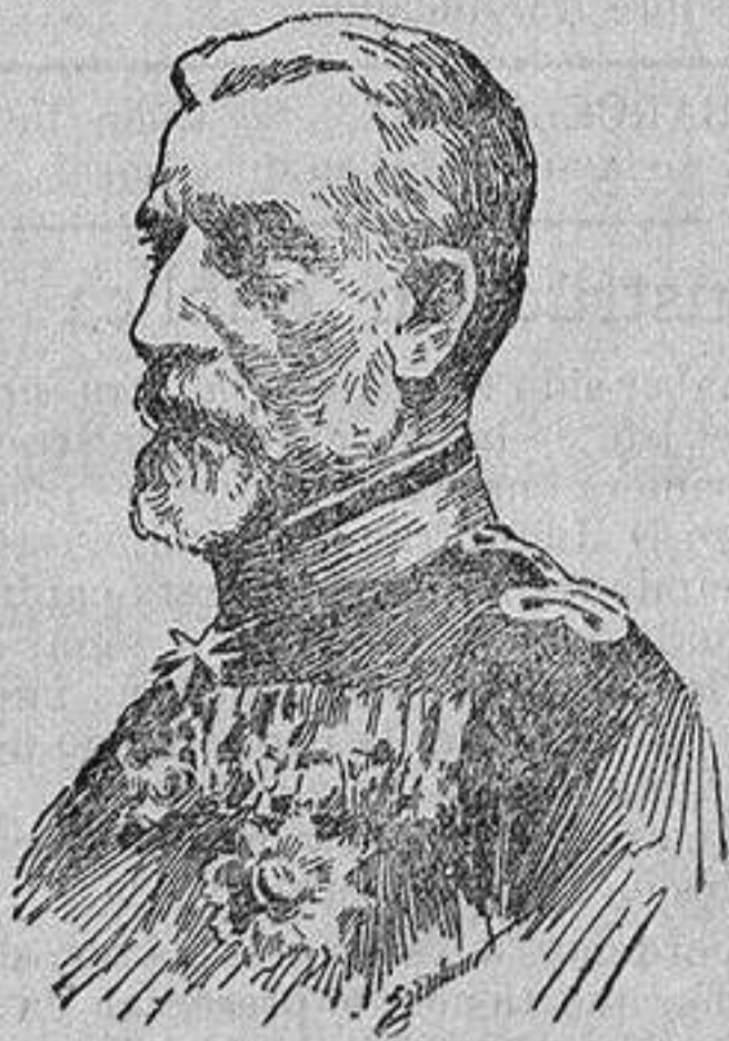
CARLOS I, REY DE RUMANÍA fallecido el sábado último