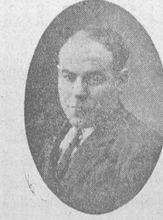
F. Abril Joaquín Costa, 54 2.º Barna Curado en 6 meses