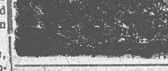
Propague V. el "Diario"