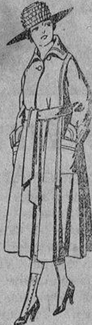
Abrigos de gamuza, ratina, etc., color, para jovencitas de 12 a 15 años, de ptas. 40 a 48.