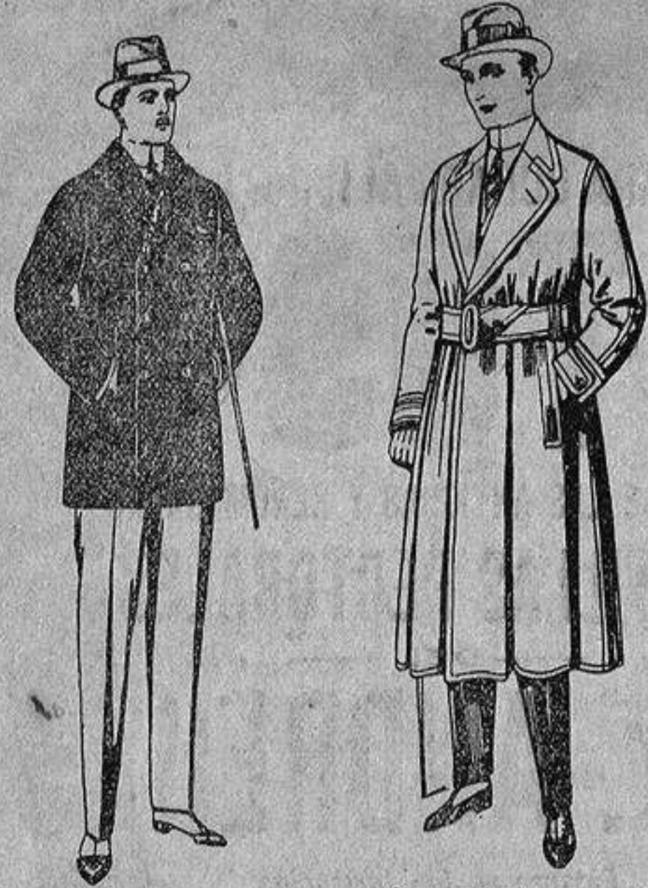
Pelizas de ratina con cuello del mismo género y con astrakán, de pesetas 16 a 90.