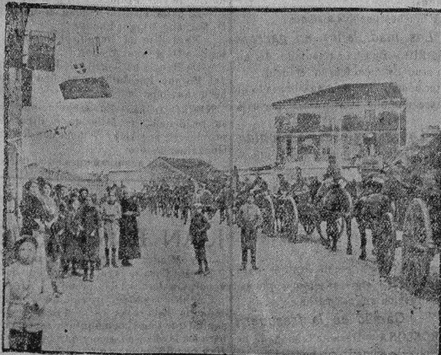
ARTILLERIA INGLESA EN ITALIA