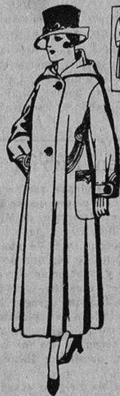
Abrigos de gamuza, pañete, etc. y color, de pesetas, 55 a 65.

Gamiseria - Géneros de punto Corbatería - Guantería Sombrerería - Zapatería Paraguas - Bastones y artículos - - - de viaje - - -