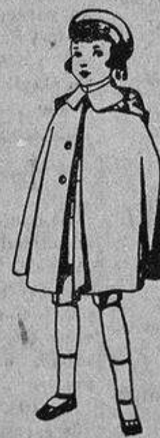
Capas de vicuña azul, para niños de 4 a 9 años, de pesetas 9 a 22.