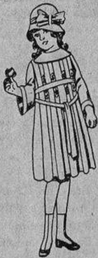
Vestidos de estambre azul bordado, para niñas de 4 a 9 años, de ptas. 30 a 38.