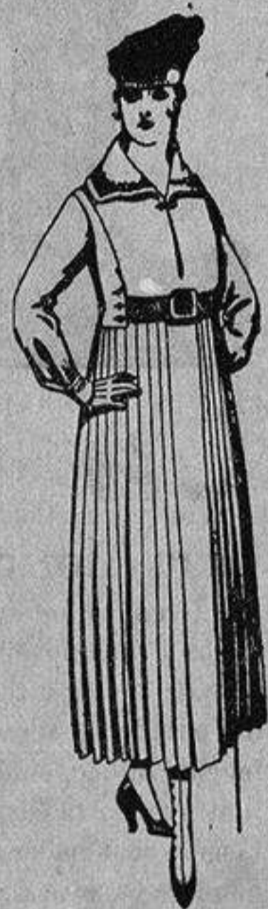
Vestidos de sarga inglesa en negro, azul y color, cuello bordado, cinturón de charol, de ptas. 68 a 75.