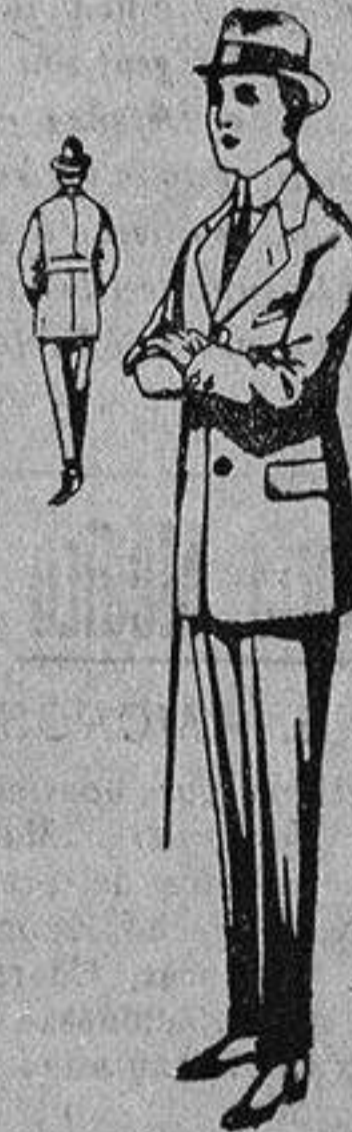
Trajes de patén, vicuña, etc., forma Sport, para niños de 10 a 12 años, de ptas. 19 a 45. Los mismos, para jovencitos de 13 a 16 años, de ptas. 21 a 48.

- PRECIO FIJO - VENTAS AL CONTADO - Pídase el Catálogo general -