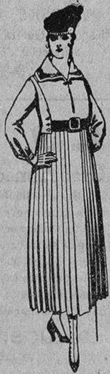
Vestidos de sarga inglesa en negro, azul y color, cuello bordado, cinturón de charol, de ptas. 68 a 76.