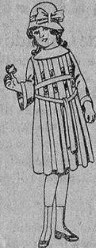
Vestidos de estambre azul bordado, para niñas de 4 a 9 años, de ptas. 30 a 38.