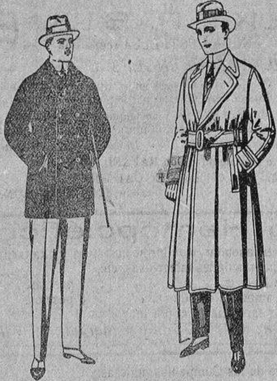
Pelizas de ratina con cuello del mismo género y con astrakán, de pesetas 16 a 90.

Madrid, Barcelona, Alicante, Almería, Bilbao, Cádiz, Cartagena, Gijón, Granada, Málaga, Palma de Mallorca, Santander, Sevilla, Valencia, Valladolid y Zaragoza.