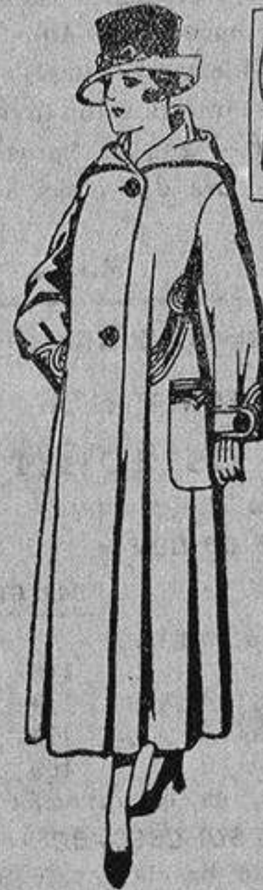
Abrigos de gamuza, pañete, etc. y color, de pesetas, 55 a 65.