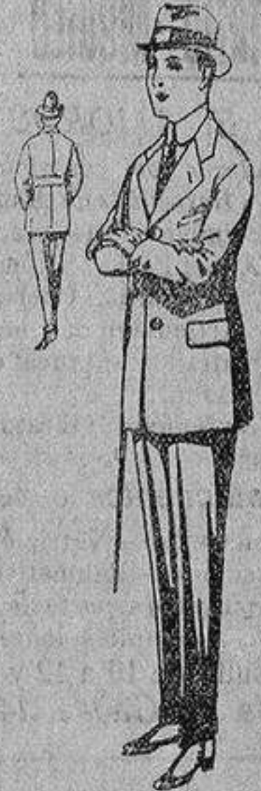
Trajes de patén, vicuña, etc., forma Sport, para niños de 10 a 12 años, de ptas. 19 a 45. Los mismos, para jovencitos de 13 a 16 años, de ptas. 21 a 48.

- PRECIO FIJO - VENTAS AL CONTADO - Pídase el Catálogo general -