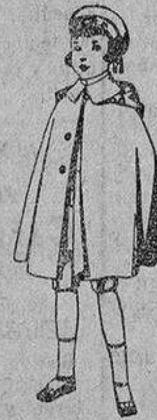
Capas de vicuña azul, para niños de 4 a 9 años, de pesetas 9 a 22.