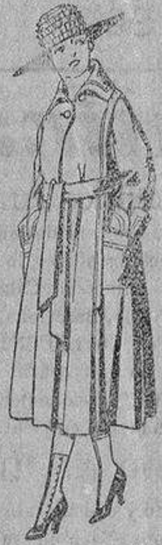
Abrigos de gamuza, ratina etc., color, para jovencitas de 12 a 15 años, de ptas. 40 a 48.