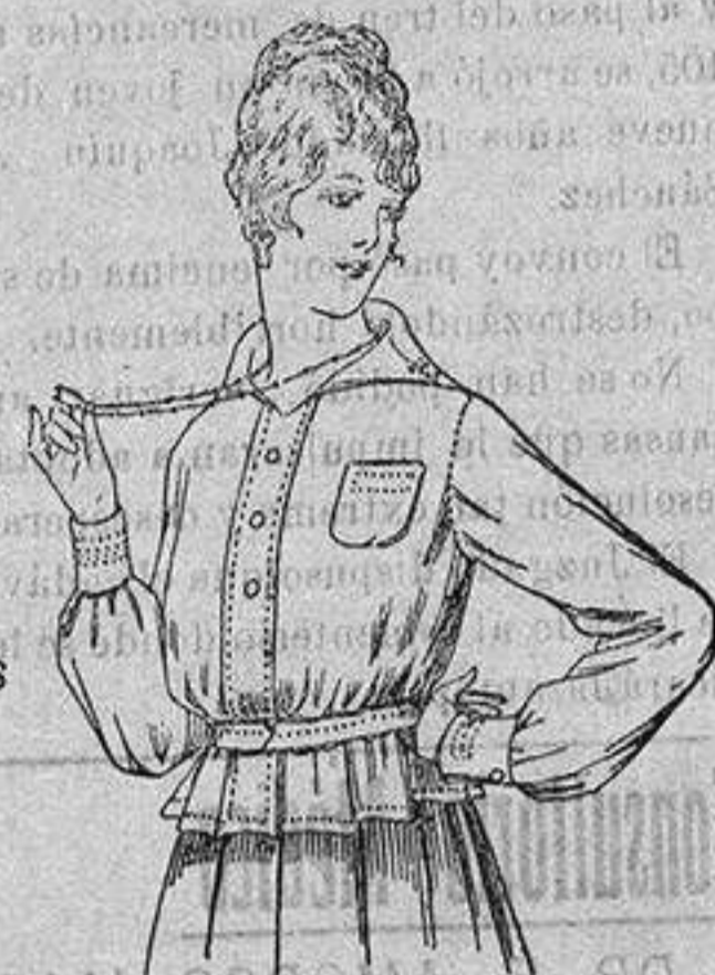
Blusa batista blanca, cuello con calados. A ptas. 4.50.

Gamisería, Cánones de Punto, Corbatería, Guantería, Sombrerería, Zapatería, Bastones, Paraguas y Artículos de Viaje