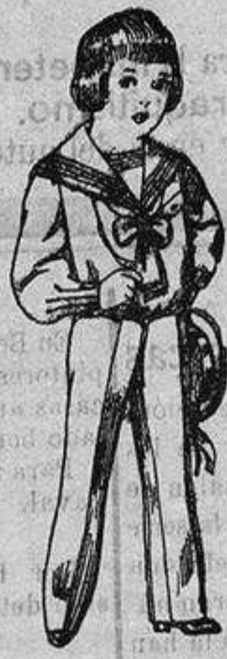
Traje de vicuña ó jerga azul y negro para niños de 4 a 9 años. De ptas. 7.50 a 22.