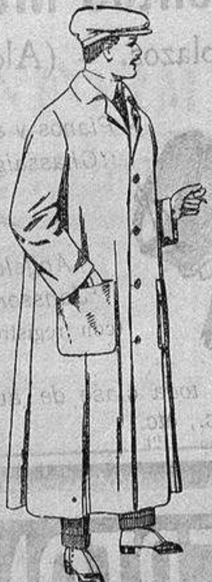
Guardapolvos de dril, color beige. De ptas. 7 a 12.

Madrid, Barcelona, Alicante, Almería, Bilbao, Cádiz, Cartagena, Gijón, Granada, Málaga, Palma de Mallorca, Santander, Sevilla, Valencia, Valladolid y Zaragoza.