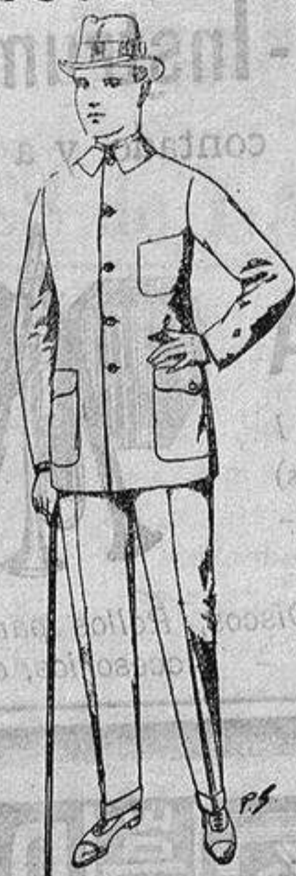
Guerteras de dril crudo kaki o blanco. De ptas. 7.50 a 11. Pantalones de dril. De ptas. 4.50 a 12.