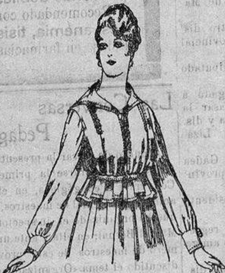
Blusa voile en blanco y negro. De ptas. 5.50 a 7.

Ropas confeccionadas para Caballero Señora, Niño y Niña