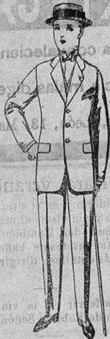
Trajes de lanilla, vicuña, etc., para jovencitos de 10 a 17 años. De ptas. 17 a 50.