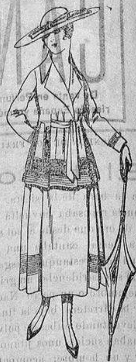
Traje de lana, gabardina negra, azul y color, diferentes bordados. De ptas. 8.50 a 90.