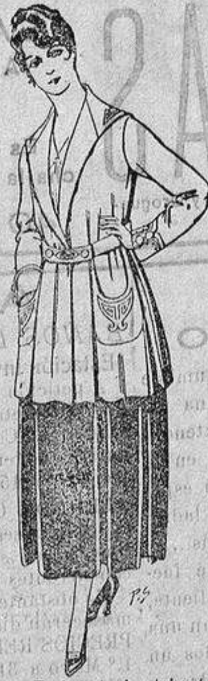
Paletot de tricot de seda o lana. De ptas. 14 a 57.