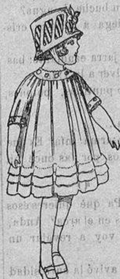
Vestidos de voile blanco, con bordados. De ptas. 7 a 10.