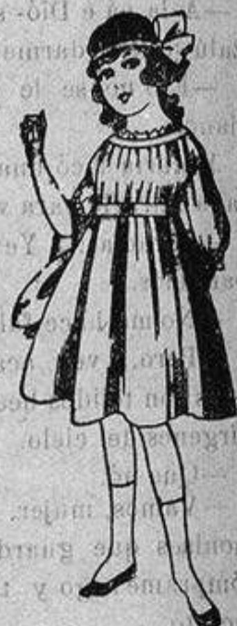
Vestido de gabardina blanca, azul y colores. De ptas. 18 a 25.