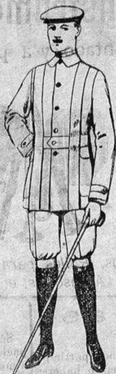
Cazadoras de dril crudo o kaki. De ptas. 12 a 20. Pantalones cortos para sportman, de dril beige. De ptas. 8 a 12