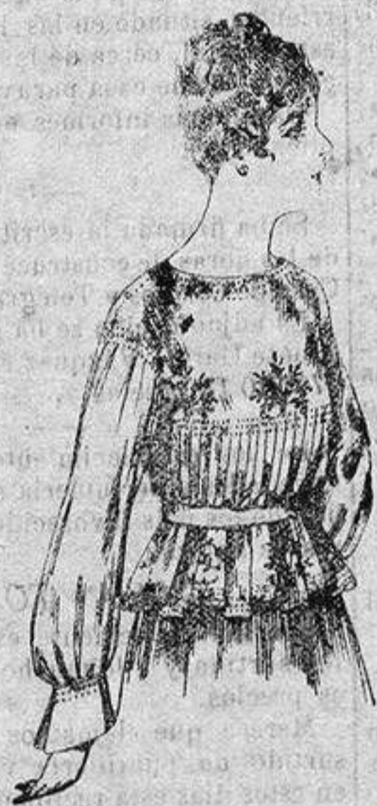
Blusa de crespón o seda, en negro, azul y color. de ptas. 33 a 35

Ropas confeccionadas para Caballero Señora, Niño y Niña