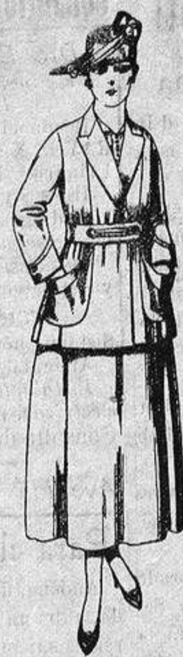
Traje de estambre negro, azul y color. de ptas. 70 a 75