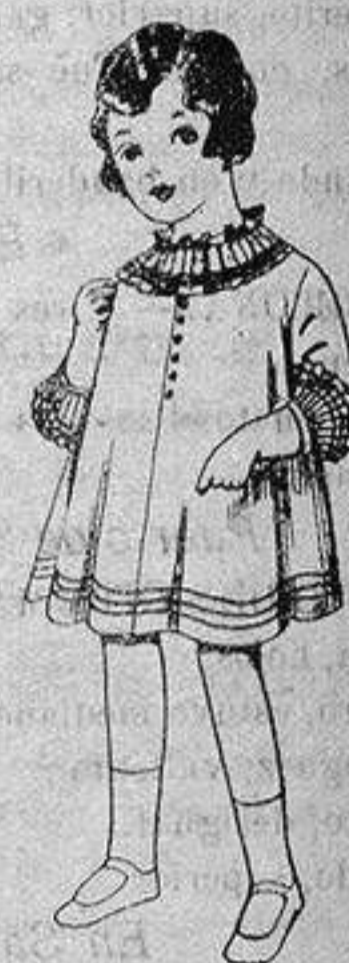
Vestido de voile blanco bordado. De ptas. 6'75 a 8