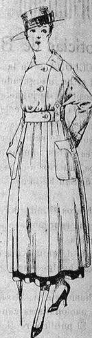
Guardapolvo de dril beige manga Ragland. a ptas. 23