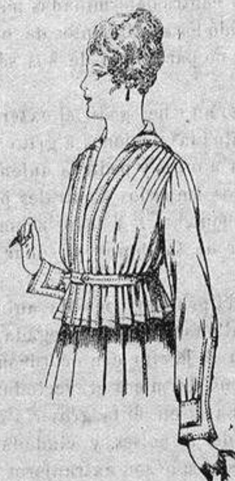
Blusa batista blanca A ptas. 5'75

Camisería, Cárneros de Punto, Corbatería, Guantería, Sombrerería, Zapatería, Bastones, Paraguas y Artículos de Viaje