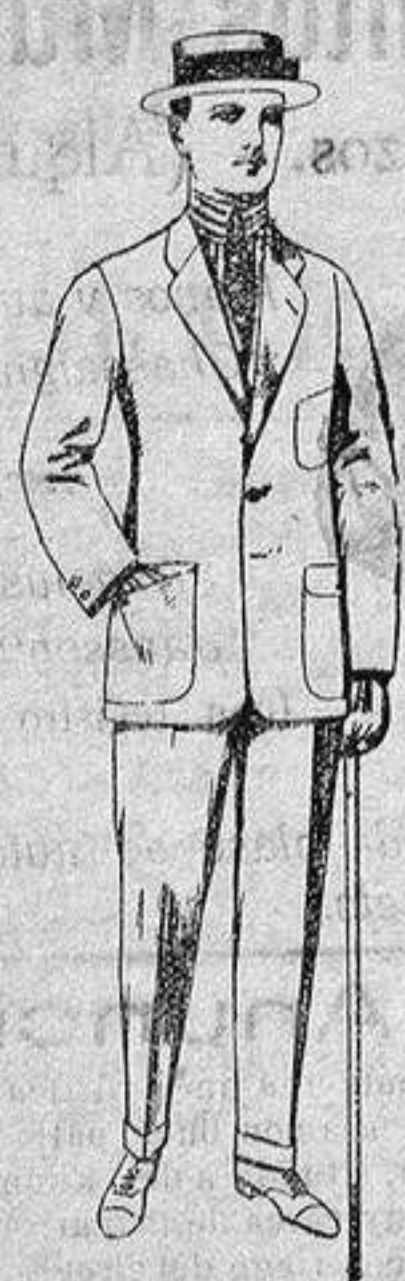
Traje de dril crudo, kaki o listado. De ptas. 10 a 38

Madrid, Barcelona, Alicante, Almería, Bilbao, Cádiz, Cartagena, Gijón, Granada, Málaga, Palma de Mallorca, Santander, Sevilla, Valencia, Valladolid y Zaragoza.