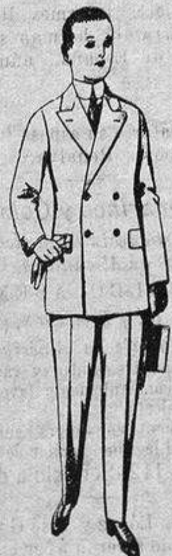
Traje de estambre, vicuña o jerga para jovencitos de 10 a 16 años. de ptas. 19 a 50