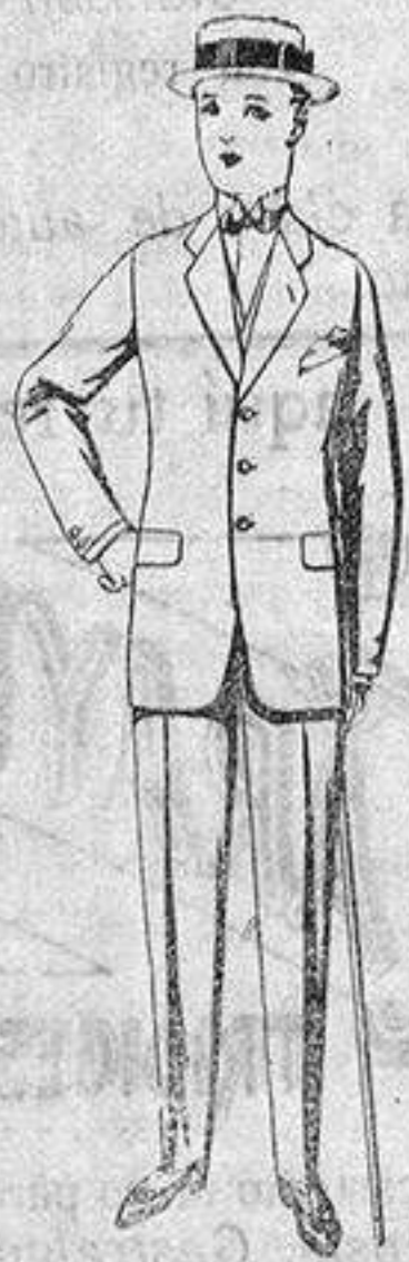
Trajes de lanilla, vicuña, etc., para jovencitos de 10 a 16 años. de ptas. 19 a 56.