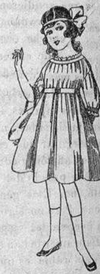
Vestidos de lanilla azul, para niñas de 4 a 9 años. De ptas. 22 a 25. Los mismos en voile. De ptas. 10 a 17