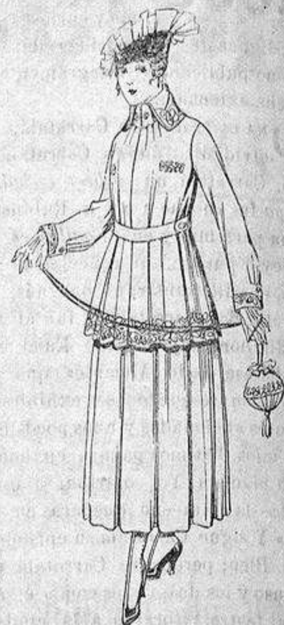
Traje de estambre, negro azul y color bordado. de ptas. 90 a 93