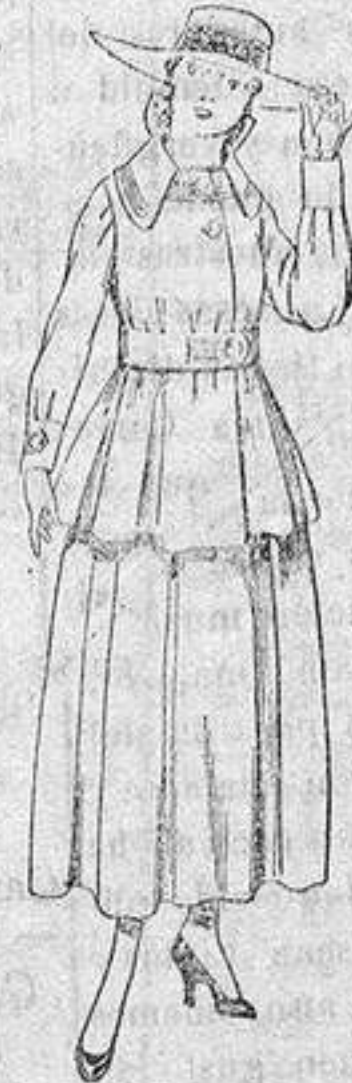
Trajes de lanilla negra, azul y color, para jovencitas de 13 a 16 años. De ptas. 50 a 55