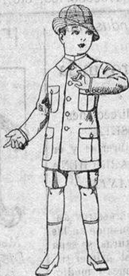
Trajes de lanilla, melton, etc., para niños de 4 a 9 años. de ptas. 16 a 33