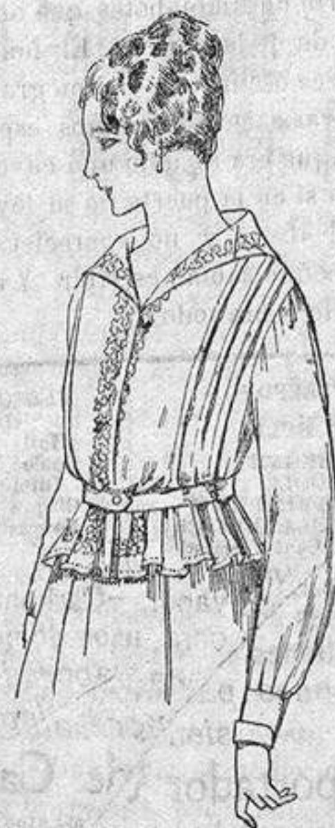
Blusa de voile blanco, bordado blanco, rosa o azul. A ptas. 9

Gamisería, Géneros de Punto, Gorbatería, Guantería, Sombrerería, Zapatería, Bastones, Paraguas y Artículos de Viaje