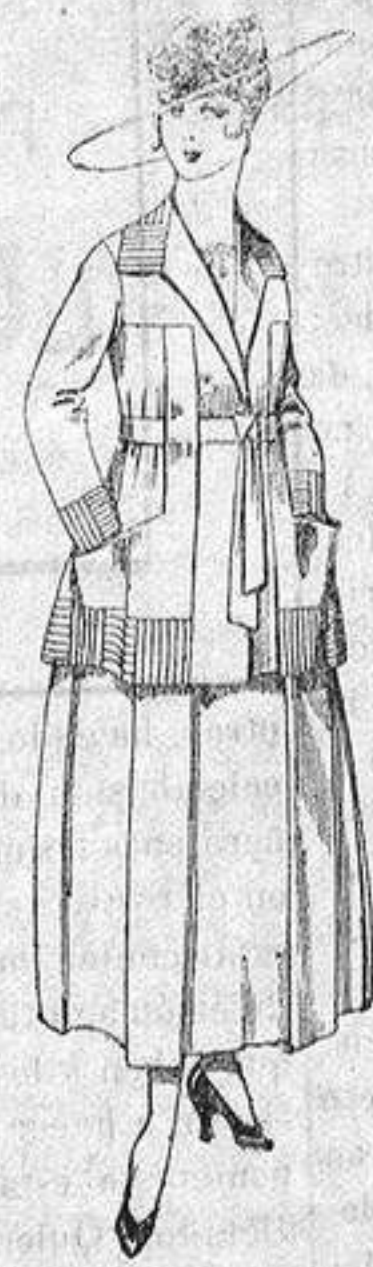
Traje lanilla negra, azul y color, bordado. a ptas. 90