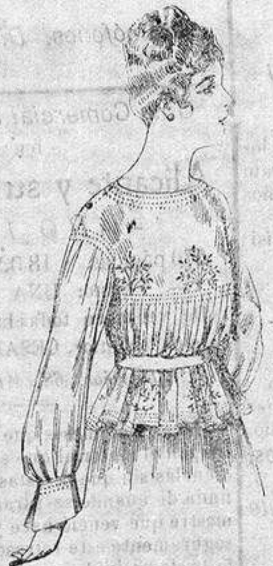
Blusa de crespón o seda, en negro, azul y color. A ptas. 33

Ropas confeccionadas para Caballero Señora, Niño y Niña