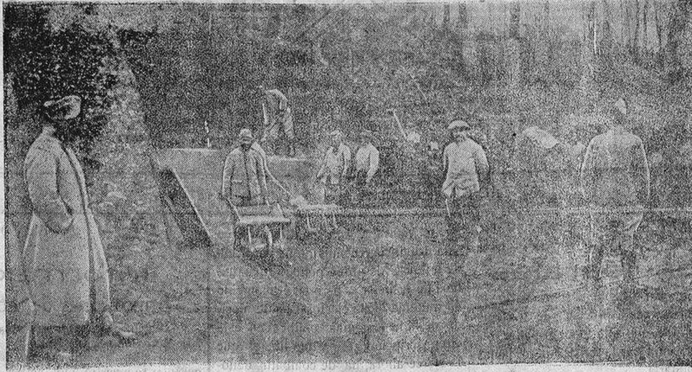
TERRAPLENANDO UNA POSICIÓN