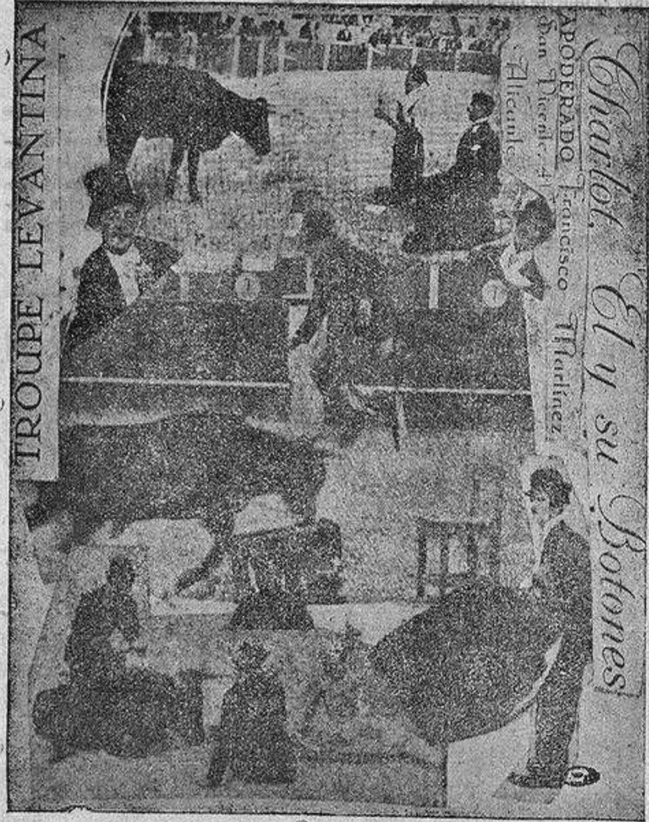
Por la estampa, puede apreciarse la excelencia del arte de tan recomendable cuadrilla de toreros bufos.

Trucos, diabluras, chanzas, valentía y sorprendentes y originalísimas faenas artísticas risibles, del toro, acreditan la buena fama de la «troupe levantina».