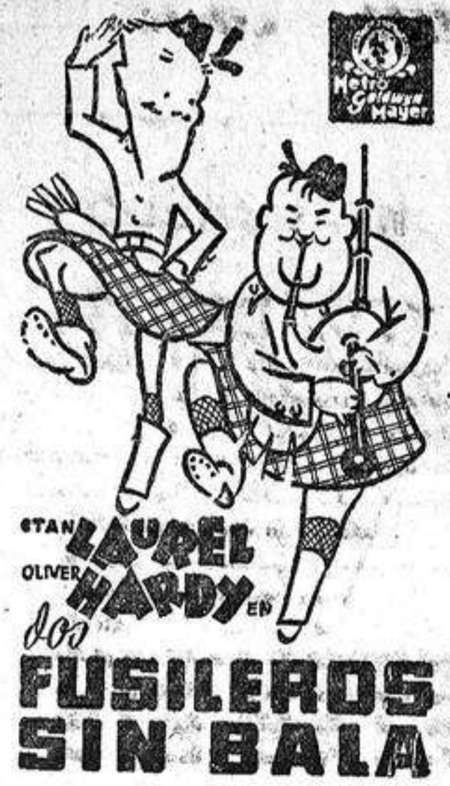
STAN LAUREL Y OLIVER HARDY EN «FUSILEROS SIN BALA» (Dibujo en colores)

Viernes, Sábado y Domingo Estreno de la producción cómica hablada en Español.