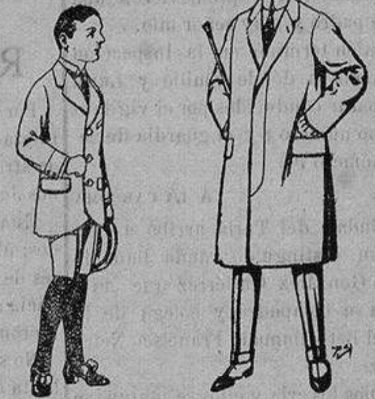
Trajes de patén para niñas de 7 a 12 años De ptas. 16 a 30 Gabanes de lana vigonia o melton, para niños de 10 a 16 años de