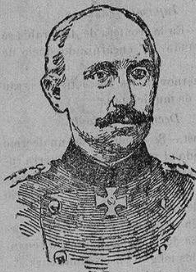
General VON BELOW, que manda el ejército alemán que opera en la región de Riga.