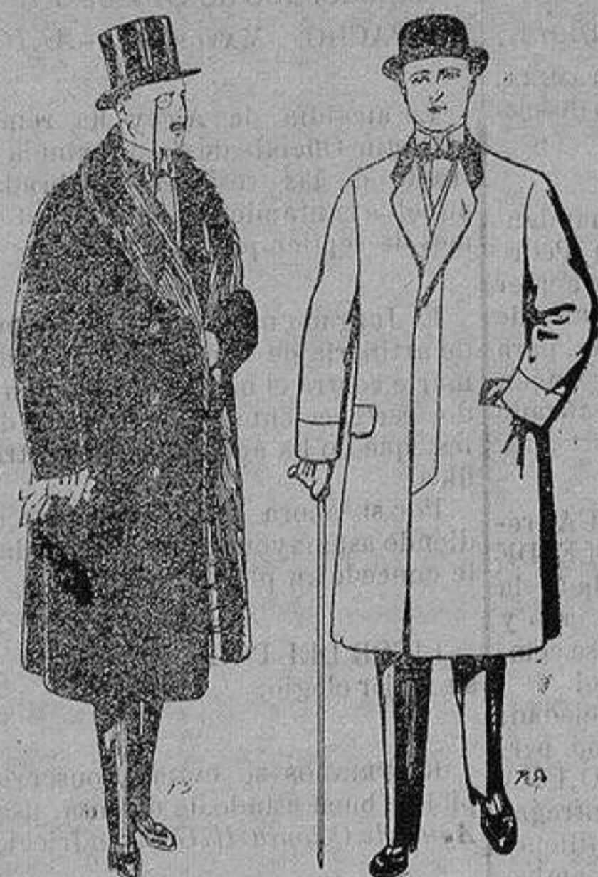
Gabanes de edredón negro, forro seda, cuello y vistas de piel De 125 y 135 ptas. Gabanes de patén melton o cheviot. De 25 a 100 ptas

Madrid, Barcelona, Alicante, Almería, Bilbao, Cádiz, Cartagena, Gijón, Granada, Málaga, Palma de Mallorca, Santander, Sevilla, Valencia, Valladolid y Zaragoza