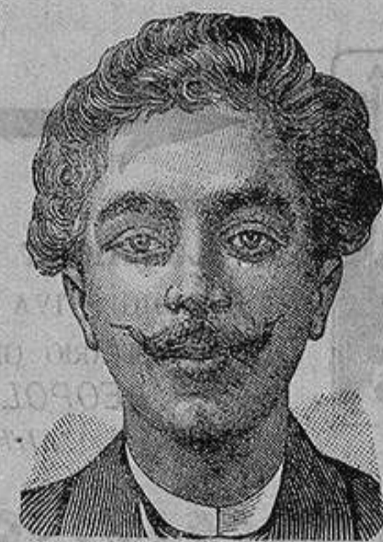
Antes de la curacion