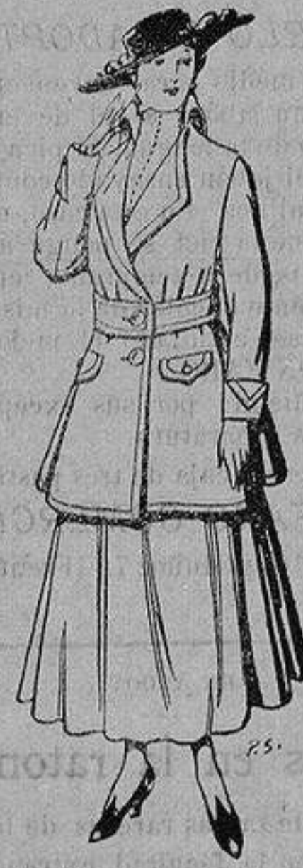
Abrigos de patén gran novedad para señora De 26 a 40 ptas.