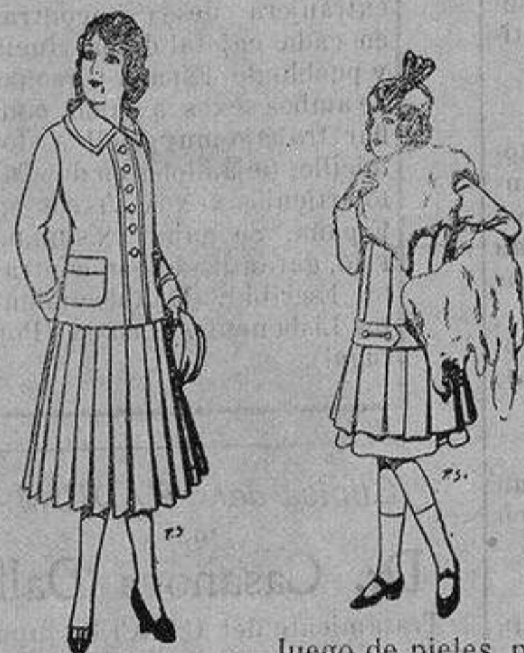
Paletot de lana para jovencitas de 13 a 16 años De 1'50 a 20 ptas Juego de pieles para niñas A ptas. 15