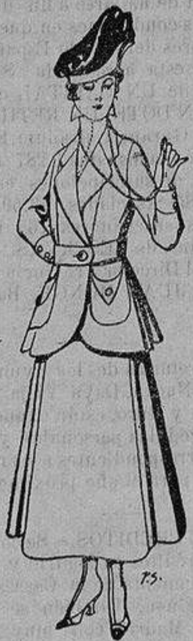
Trajes de lana negra, azul y color, para señora De ptas. 50 a 55