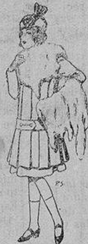
Juego de pieles para niñas A ptas. 15