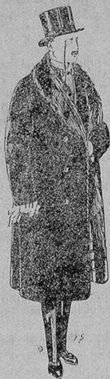
Gabanes de edredón negro, forro seda, cuello y vistas de piel De 125 y 135 ptas.

Peletería, Camisería, Generos de Punto, Corbatería, Guantería, Sombrerería, Zapatería, Paraguas, Bastones y Artículos de Viaje.