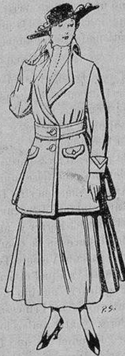
Abrigos de patén gran novedad para señora De 26 a 40 ptas.