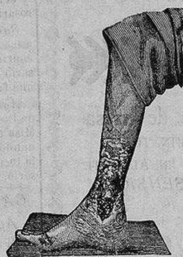
Antes de la curacion