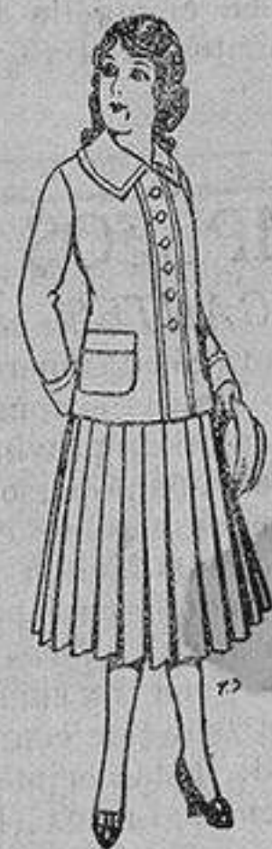
Paletot de lana para jovencitas de 13 a 16 años De 12'50 a 20 ptas