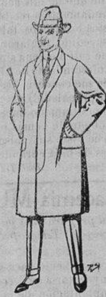
Gabanes de lana vigonia o melton, para niños de 10 a 16 años