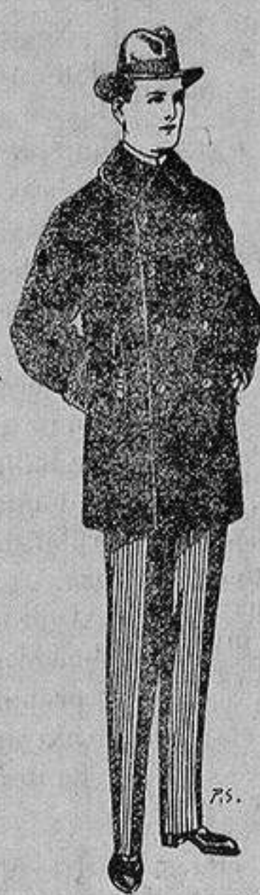
Pellizas con cuello y bocamangas astrakan De 14 a 90 ptas.