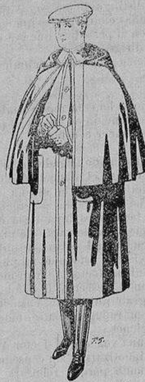
Gabanes de lana vigonia o melton, para niños de 10 a 16 años De ptas. 20 a 56