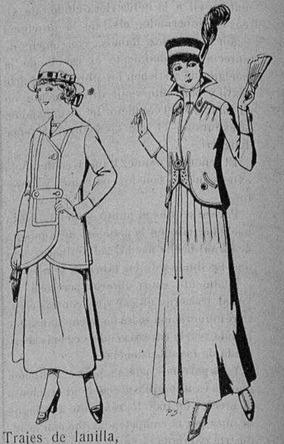
Trajes de lanilla, para jovencitas de de 13 a 15 años De ptas. 27 a 30 Trajes de lana negra, azul, para señora A 55 ptas.