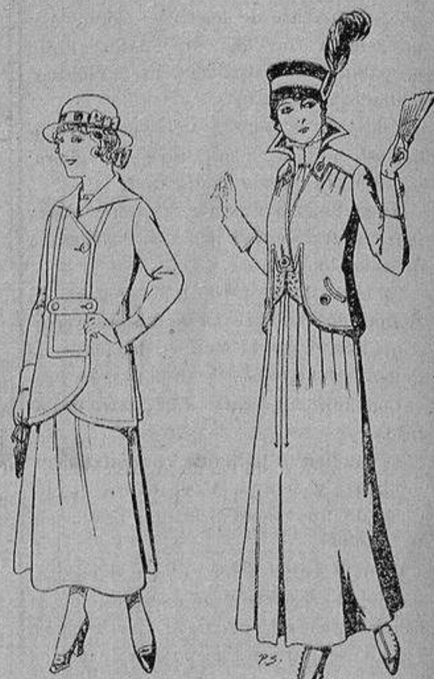
Trajes de lanilla, para jovencitas de de 13 a 15 años De ptas. 27 a 30 Trajes de lana negra, azul, para señora A 55 ptas.