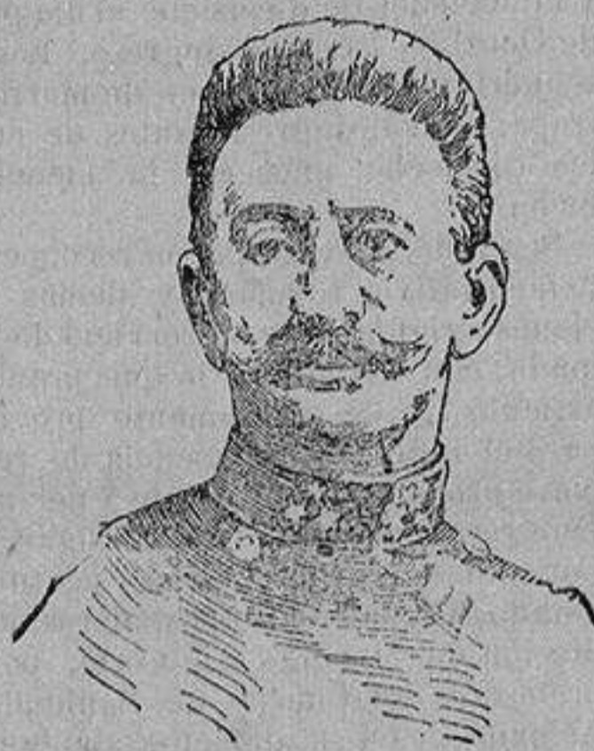
General CONRAD HOETZENDORF generalísimo del ejército austriaco del Friul

Viena.—Parece ser que los generales rusos han recibido la orden de no intentar una nueva ofensiva hasta que los austro-alemanes retiren fuertes contingentes que destinan a la campaña de Italia. Entre tanto se limitarán a la defensiva atacando solamente en la Galitzia occidental. Los italianos avanzan sobre Torino. Las tropas austriacas hasta ahora exponen escasa resistencia. En la frontera de Carantera bombardeó el enemigo, sin éxito, las posiciones austriacas. Desde Lavaronne bombardearon las fuerzas fronterizas. En el litoral continúa el combate de artillería. Hasta hoy han tenido los italianos trescientas bajas. Los italianos intentaron pasar Isenoz cerca de Sagrada. Tras un combate muy sangriento fueron rechazados.