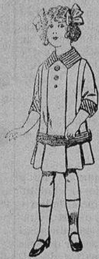
Vestidos de dril para niñas de 4 a 12 años De ptas. 5 a 12