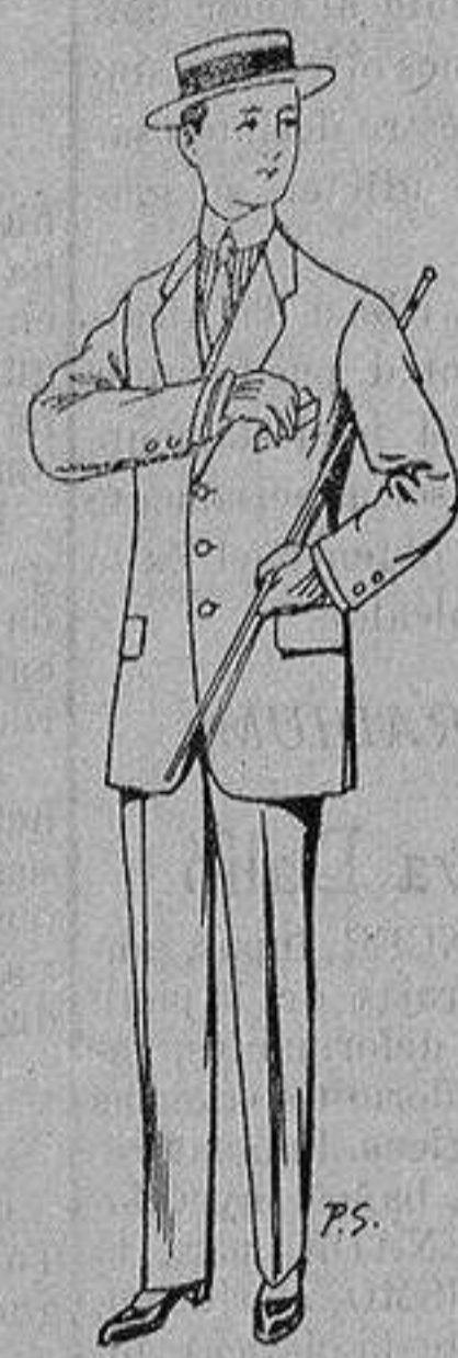
Trajes de lanilla, vi- cuña, etc., para niños de 10 a 16 años De ptas. 14 á 48