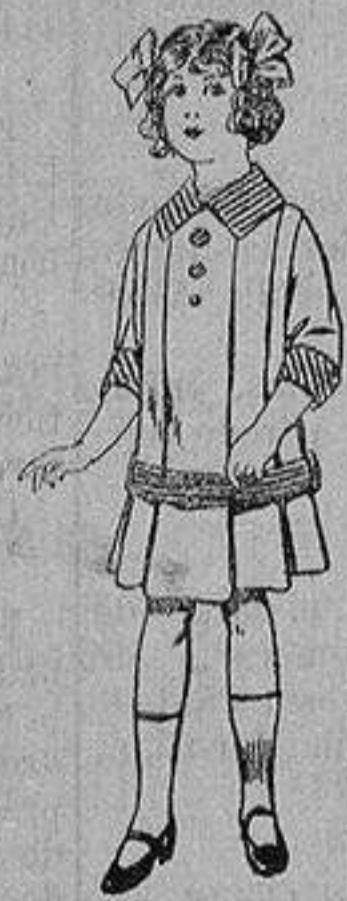
Vestidos de dril para niñas de 4 a 12 años De ptas. 5 a 12