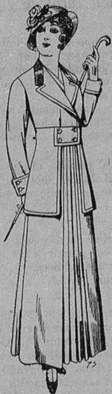
Trajes de lana ne- gra azul y color pa- ra señora A ptas. 70

Madrid * Barcelona * Almería * Bilbao * Cádiz Cartagena * Gijón * Granada * Málaga * Pal- ma de Mallorca * Santander * Sevilla * Valencia Valladolid y Zaragoza