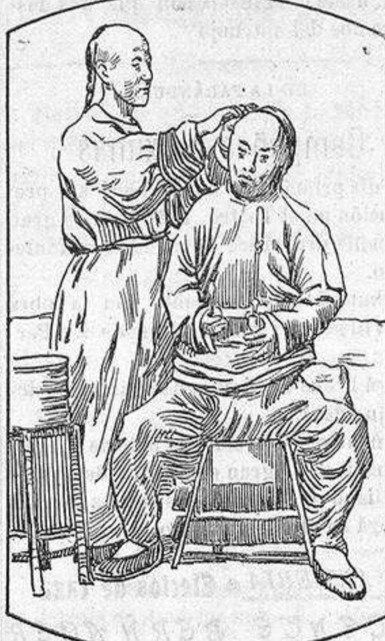
Un barbero en funciones. Tipo de las provincias del Sur, primeramente insurreccionadas contra la autoridad del Emperador