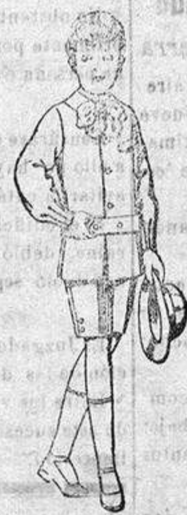
Trajes de lanilla melton, et. para niño de 4 a 9 años, de pesetas 10 a 18.