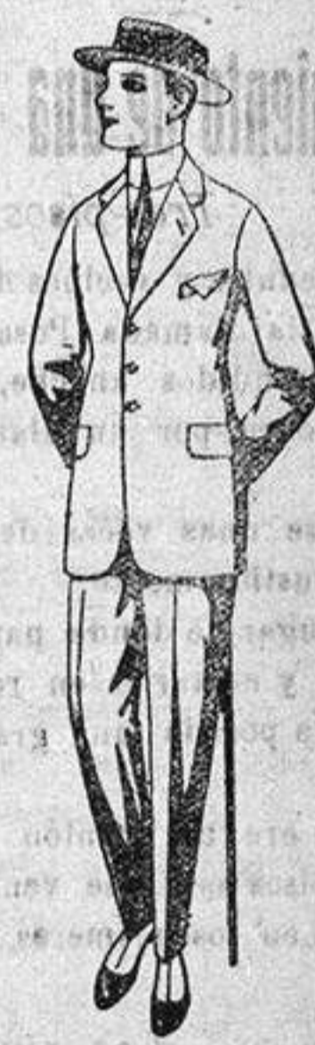
Trajes de dril crudo, kaki o listado, para jovencitos de 10 a 16 años, de ptas. 19 a 53.

PRECIO FIJO - VENTAS AL CONTADO - Pídase el catálogo general