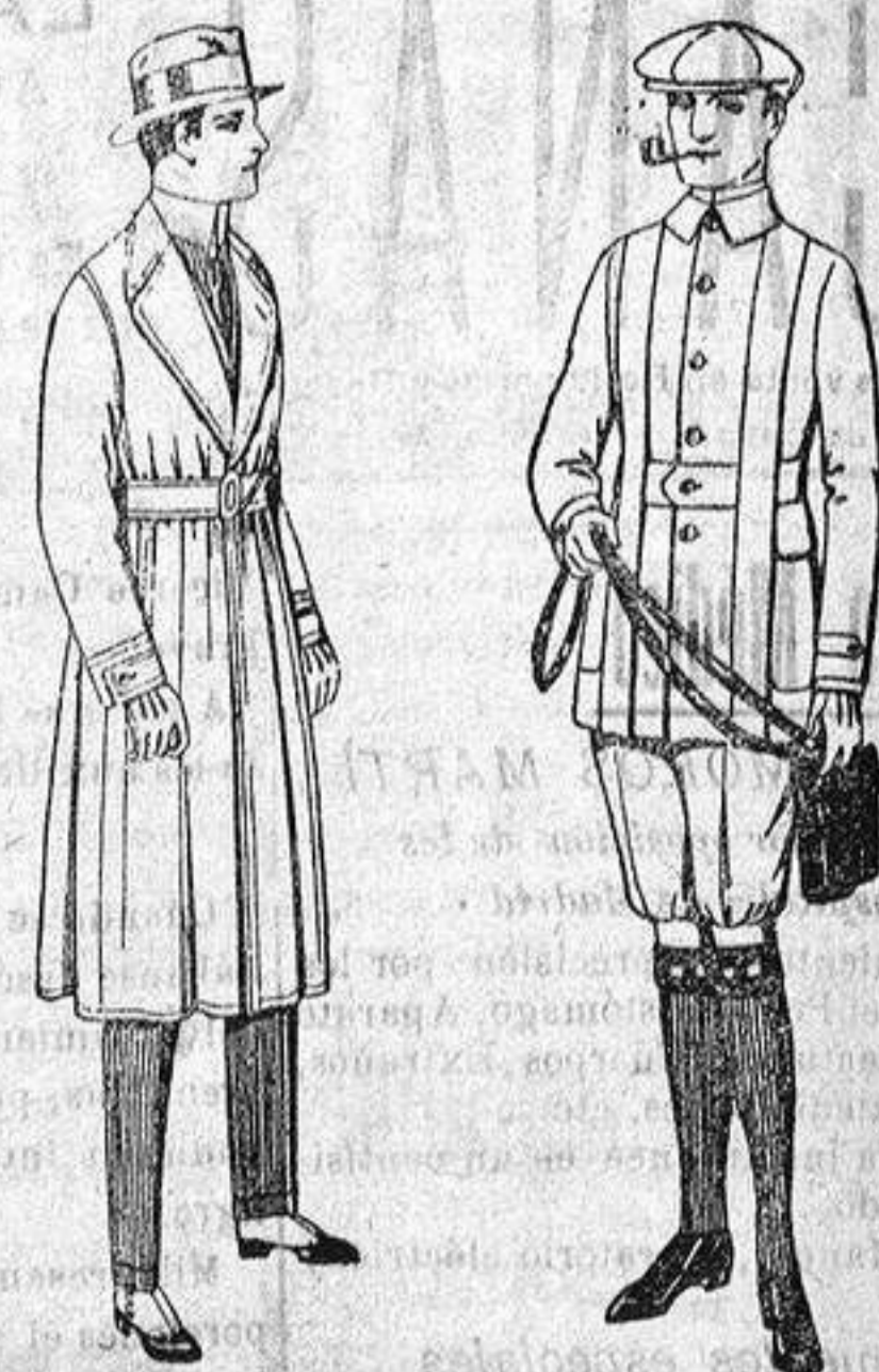
Gabanes de gabardina impermeabilizada, diferentes colores, de ptas. 43 a 15.