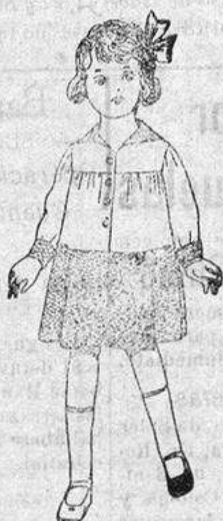
Vestidos de etamín blanco, combinados etamín listado, para niñas de 3 a 6 años, de pesetas 6'50 a 8'50.