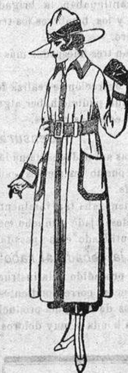
Abrigos de gabardina inglesa impermeabilizados, en color beige, bordados, de ptas. 80 a 95.

Camisería - Géneros de punto Corbatería - Guantería Sombriería - Zapatería Paraguas - Bastones y artículos de viaje