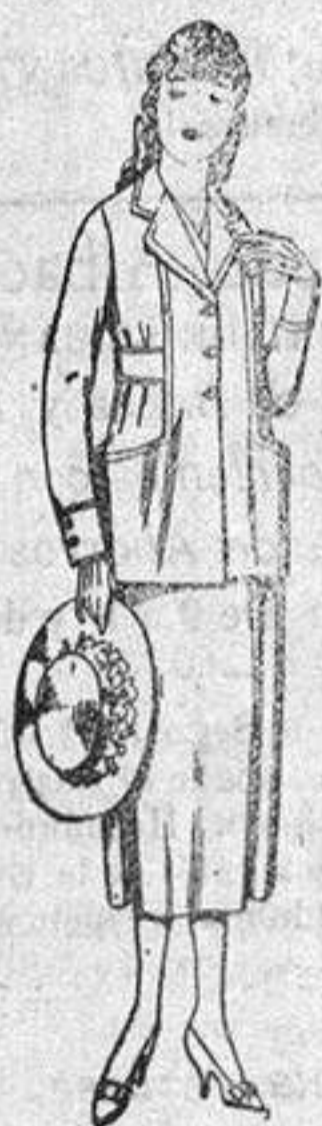
Trajes de estambre, gabardina, etc., en azul y calor, de pesetas 48 a 58.