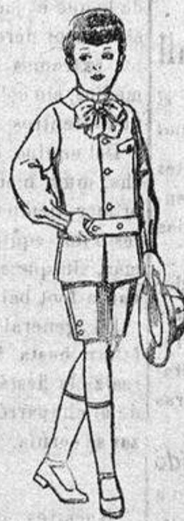
Tripes de l'nylla melton, para niños de 4 a 9 años, de ptes. 10 a 18.