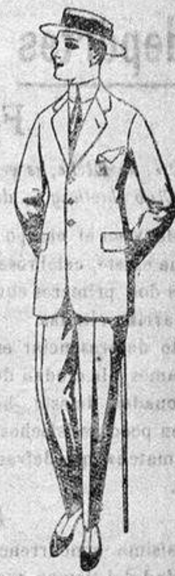
Tripes de dril crudo, kaki o listado, para juveniles de 10 a 16 años, de ptes. 19 a 35.