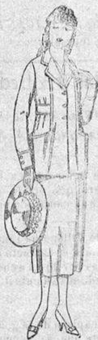
Tripes de estambre, gabardina, etc., en azul y color, de ptes. 48 a 58.