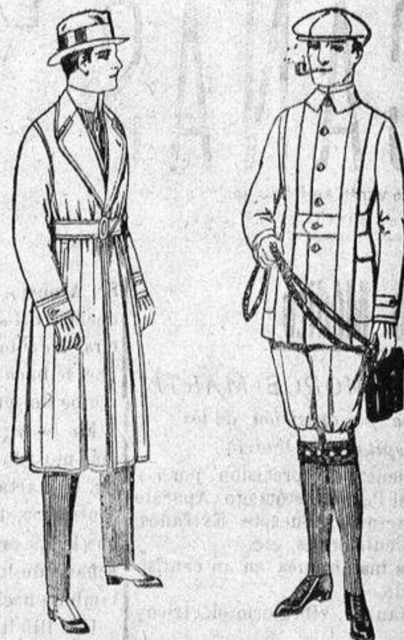
Gabanes de gabardina impermeabilizada, de ptes. 48 a 15.