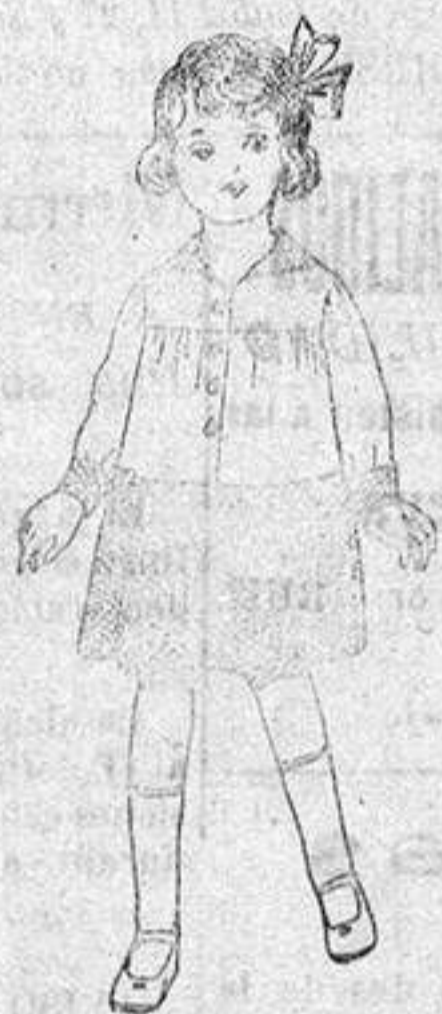
Vestidos de algodón blanco, con botones e a la moda, de ptes. 6 50 a 8 50.