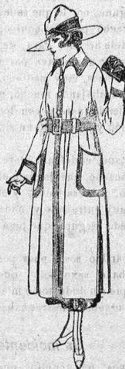
Abrigos de gabardina impermeabilizados, en color beige, bordados, de ptes. 80 a 95.