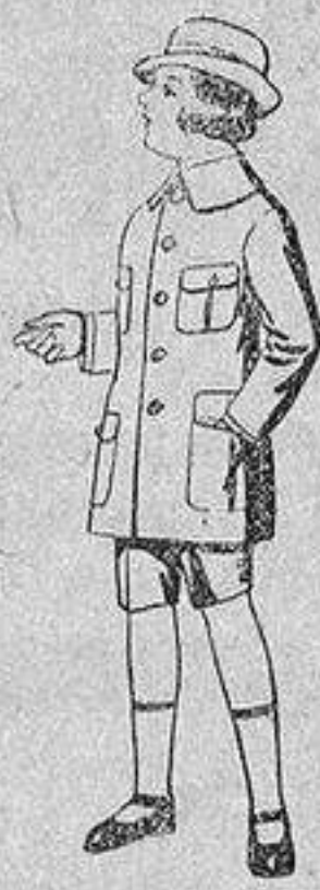
Trajes de patén modelo «Sport», para niños de 4 a 9 años.