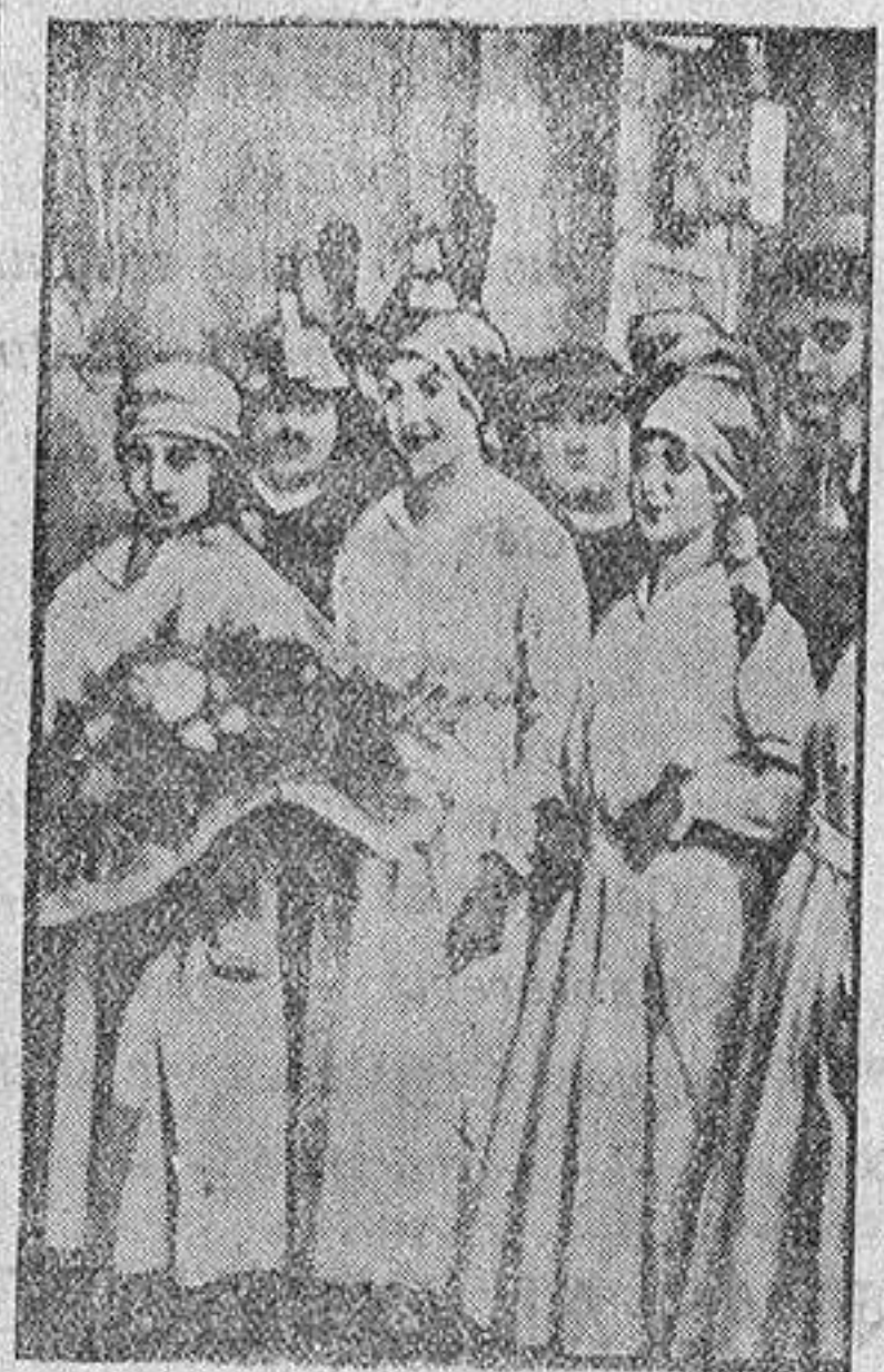
Damas de la Cruz Roja italiana esperando a las tropas francesas en Brescia.