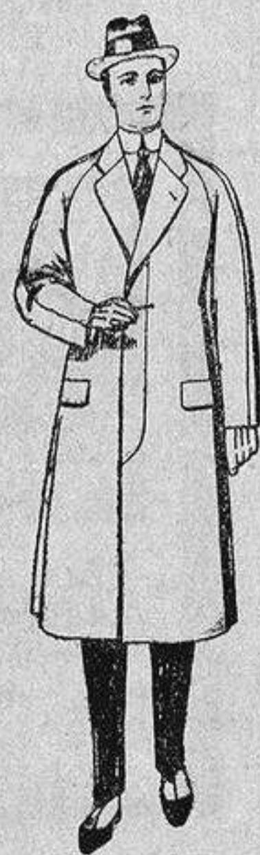
Gabanes de patén, melton o cheviot, con forro de seda, satén o escocés, de ptas. 50 a 100