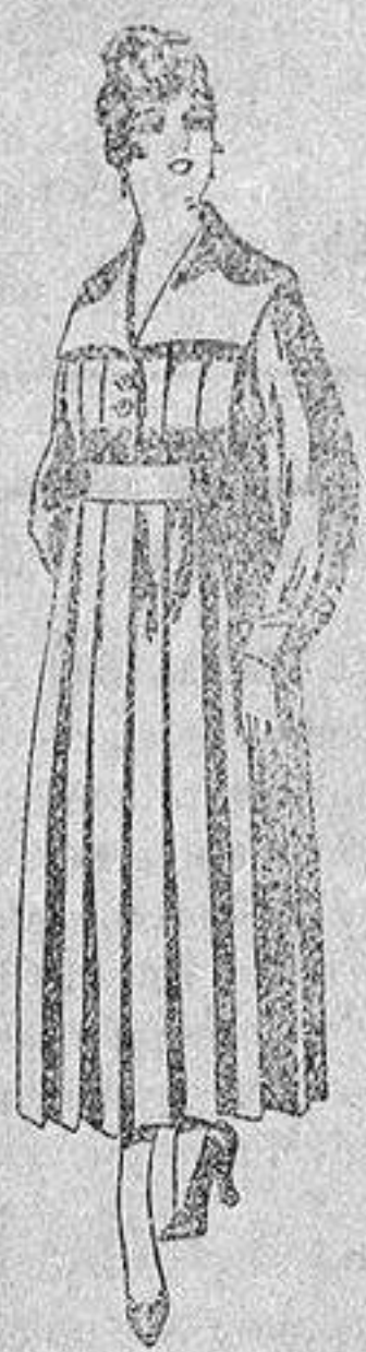
Batas de lanilla diferentes colores, a pesetas, 25.

Madrid, Barcelona, Alicante, Almería, Bilbao, Cádiz, Cartagena, Gijón, Granada, Málaga, Palma de Mallorca, Santander, Sevilla, Valencia, Valladolid y Zaragoza.