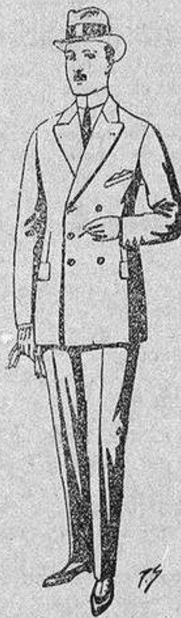
Trajes de cheviot, melton etc., de ptas. 26 a 85. Los mismos en vicuña o jerga, de ptas. 32 a 90.

Gamisería - Géneros de punto Corbatería - Guantería Sombrerería - Zapatería Paraguas - Bastones y artículos - - - de viaje - - -