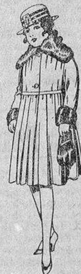
Abrigos de terciopelo de lana, pañete, gamuza, etc., cuello y bocamangas piel, para niñas de 4 a 9 años, de pesetas 28 a 48