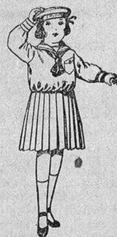
Trajes de marinera de sarga inglesa azul, para niñas de 4 a 9 años, de ptas. 30 a 38.