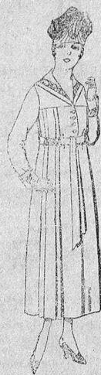
Vestidos de sarga inglesa, en negro, azul y color, bordados, de de ptas. 60 a 70