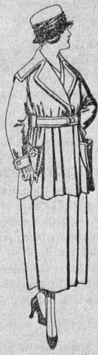
Paletots felpa de seda, diferentes colores, de ptas. 60 a 65.