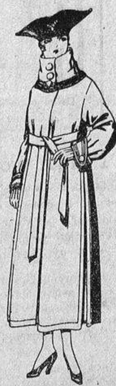
Abrigos de pañete, colores azul, beige y café, de pes. 65 a 85.