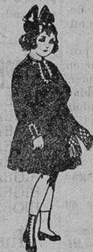
Vestidos de laniña, para niñas de 4 a 9 años. De ptas. 18 a 34.