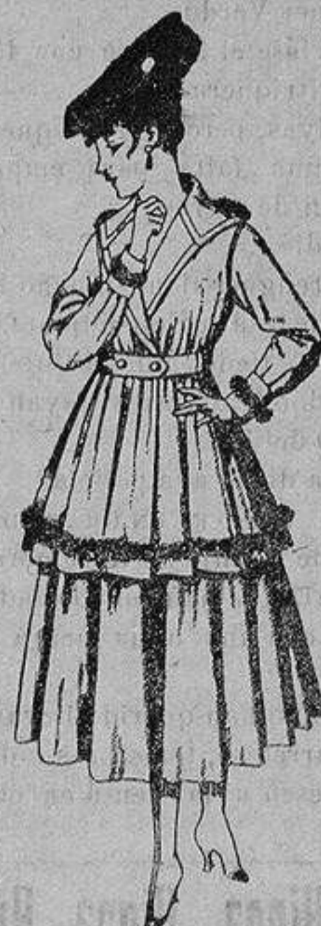
Traje de punto, en color para señora. De ptas. 100 a 130