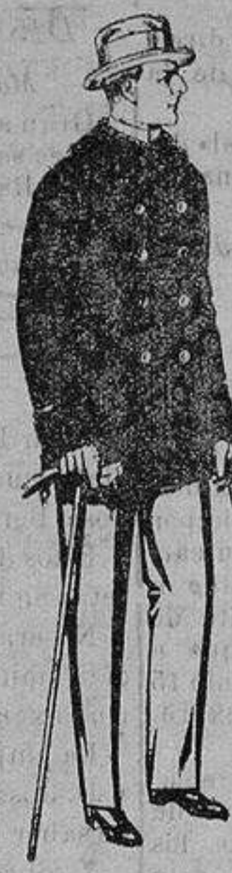
Pellizas de ratina con cuello del mismo género y con astrakan De ptas. 16 a 90