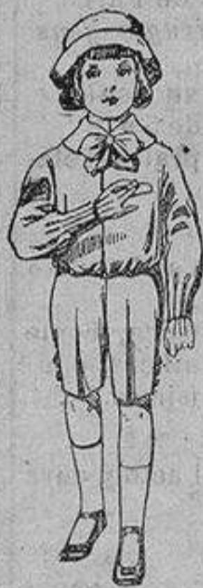
Trajes de patén para niños de 4 a 9 años. De ptas. 9 a 14