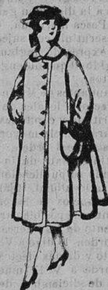
Abrigos de lana para jovencitas de 11 a 15 años De ptas. 35 a 40

SECCIONES: Peletería, Camisería, Géneros de Punto, Corbatería, Guantería, Sombrerería, Zapatería, Paraguas, Bastones y Artículos de Viaje.