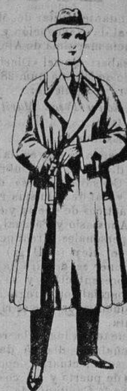
Gabanes impermeabilizados, con cinturón color beiget De ptas. 43 a 110