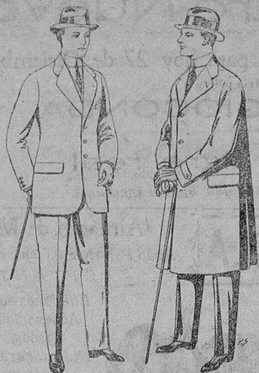
Trajes de cheviot, patén, etc. De ptas. 21 a 80 Gabanes de tejido pluma o ratina De ptas. 33 a 110