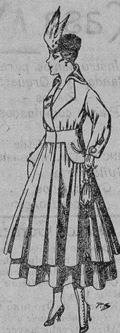
Abrigo de patén en color, para señora. De ptas. 80 a 100