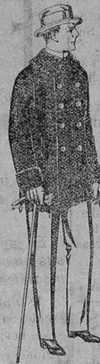
Pellizas de ratina con cuello del mismo género y con astrakan De ptas. 16 a 90