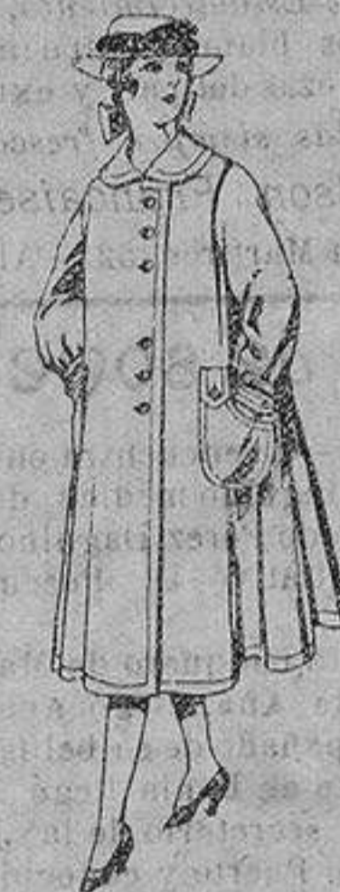
Abrigos de lana para jovencitas de 11 a 15 años De ptas. 35 a 40