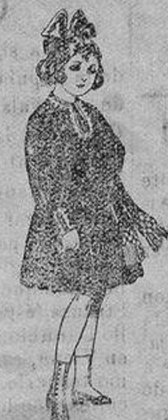
Vestidos de lanilla, para niñas de 4 a 9 años De ptas. 18 a 34