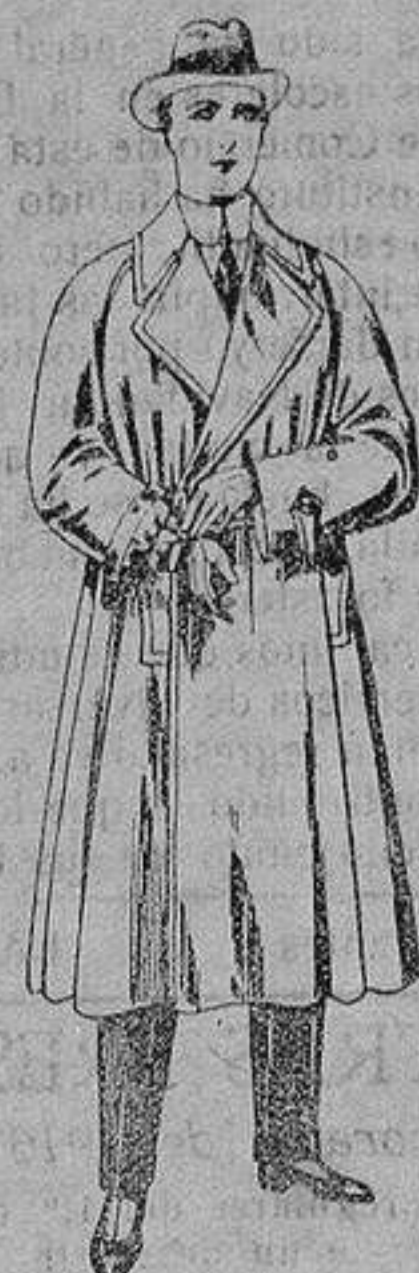
Gabanés impermeabilizados, con cinturón color beige De ptas. 43 a 110