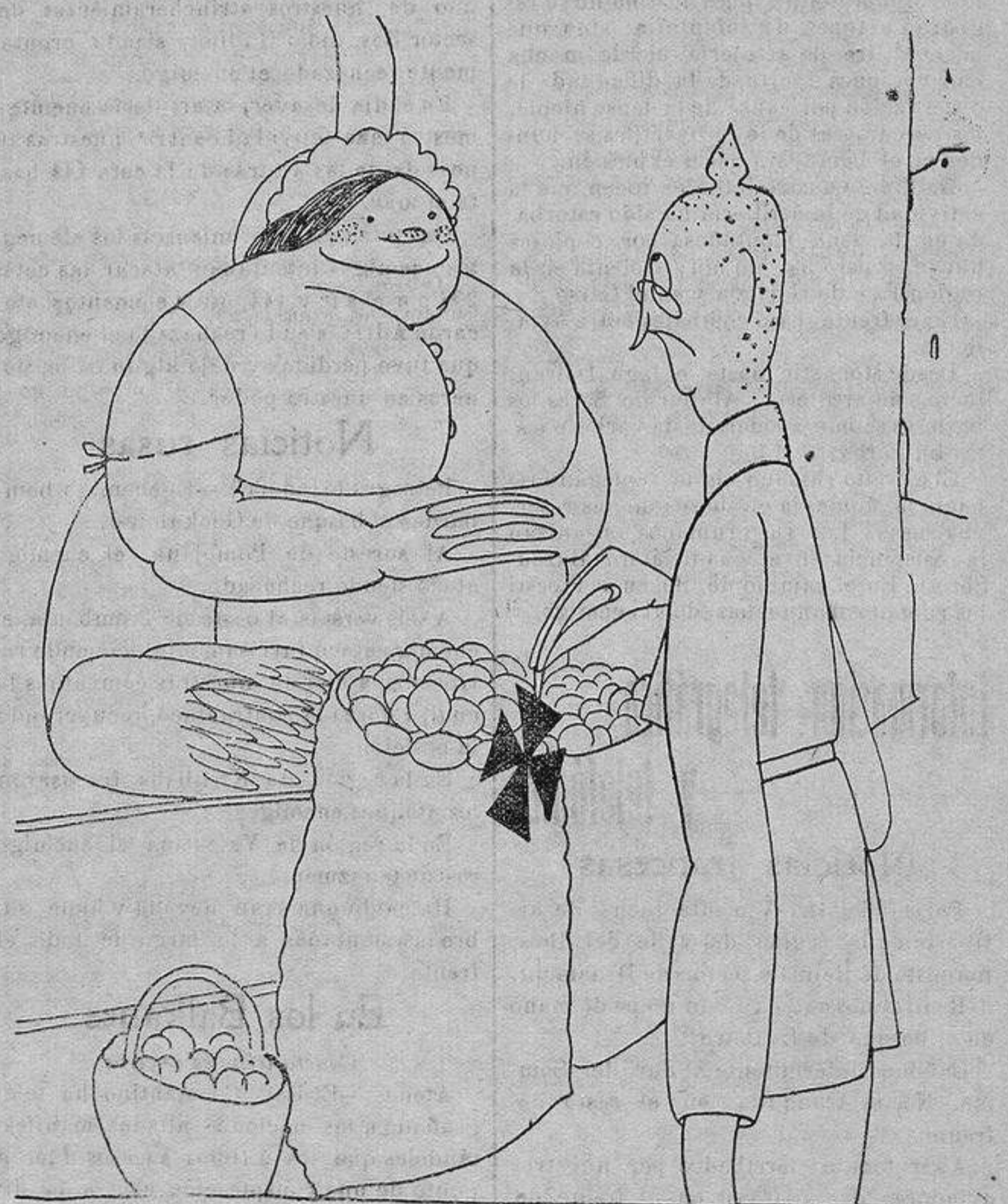
EL TEUTÓN VICTORIOSO.---Ande... tres patatas por esta Cruz de Hierro.