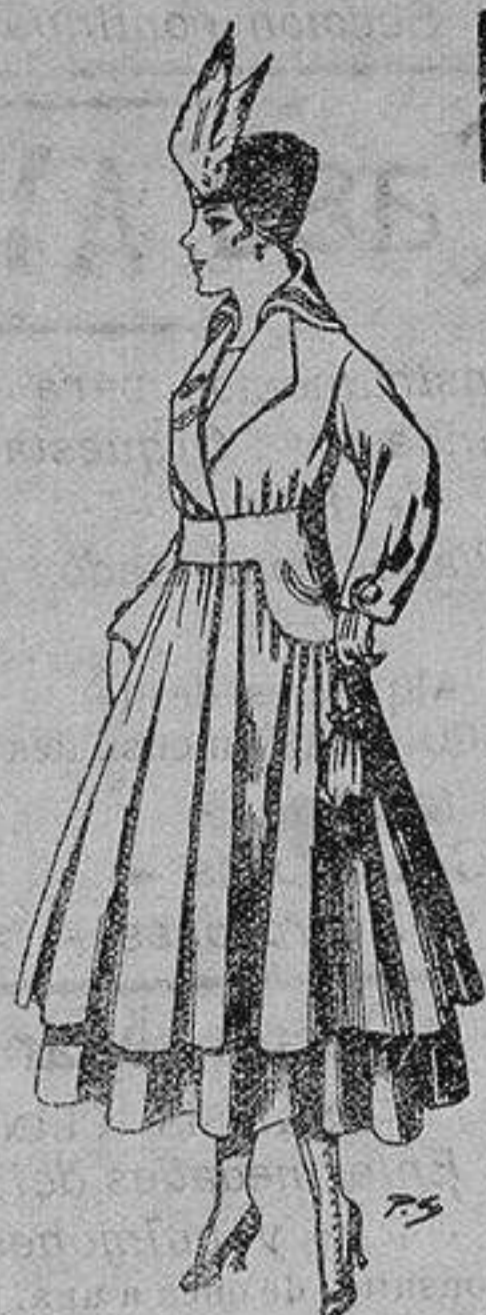
Abrigo de patén en color, para señora. De ptas. 80 a 100

Sucursales: Madrid, Barcelona, Alicante, Almería, Bilbao, Cádiz, Cartagena, Gijón, Granada, Málaga, Palma de Mallorca, Santander, Sevilla, Valencia, Valladolid y Zaragoza.