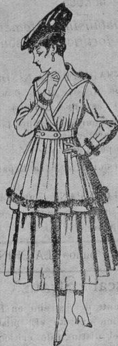
Traje de punto, en color para señora. De ptas. 100 a 130

Precio Fijo - Ventas al contado Pídase el Catálogo General