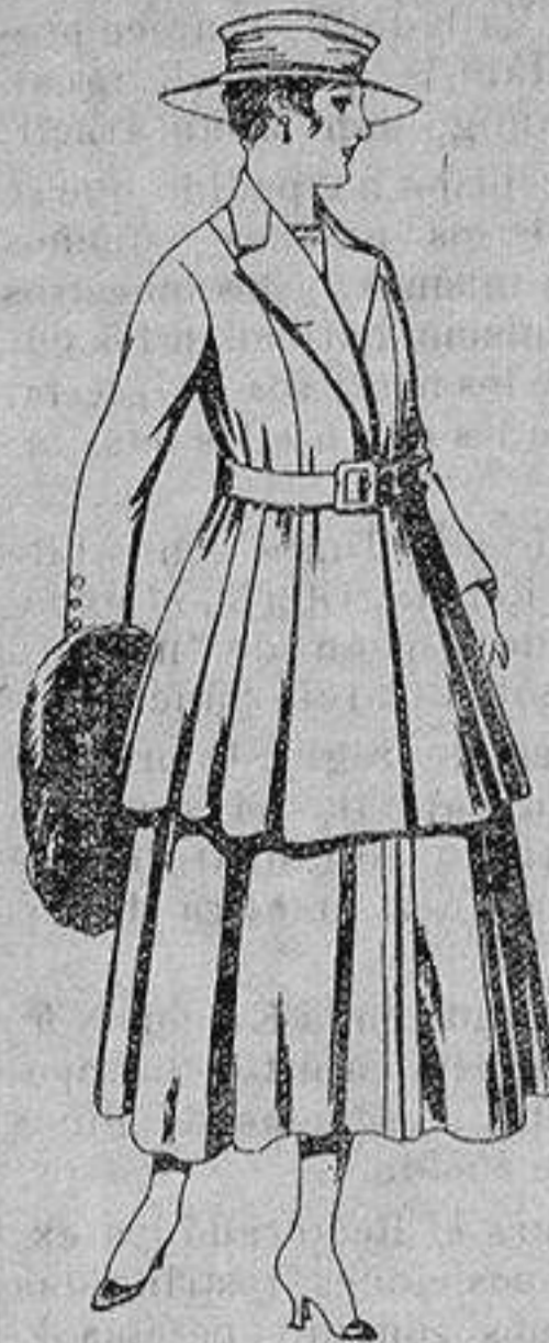
Traje de lana, para señora, en color negro y azul. De ptas. 85 a 100

Precio Fijo - Ventas al contado Pídase el Catálogo General