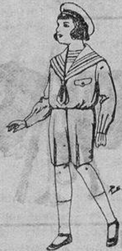
Trajes de patén para niños de 4 a 9 años. De ptas. 9 a 22

SECCIONES: Peletería, Camisería, Géneros de Punto, Corbatería, Guantería, Sombrerería, Zapatería, Paraguas, Bastones y Artículos de Viaje.