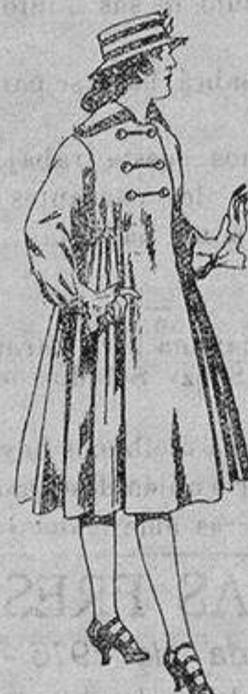
Abrigos de patén para jovencitas de 11 a 15 años. De ptas. 35 a 50