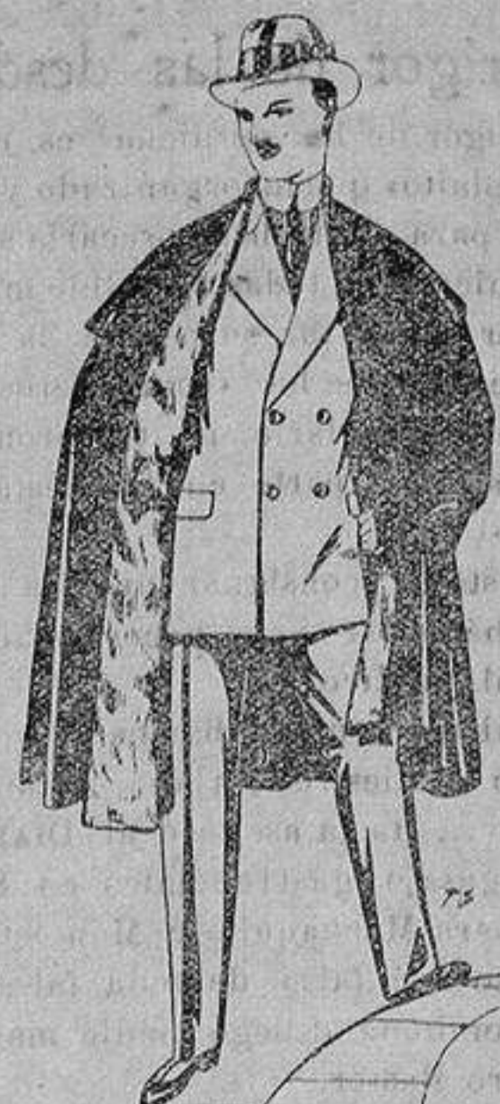
Capas (enteras) de paño de Béjar y Tarraza, embozos de peluche, terciopelo, astrakán o escocés. De ptas. 35 a 115