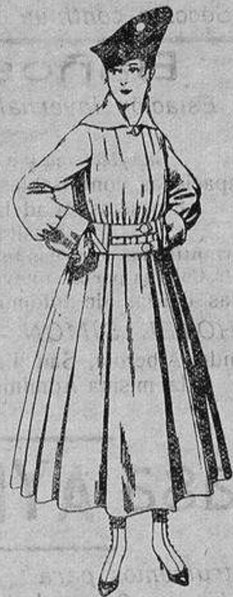
Abrigo de patén en color, para señora. De ptas. 50 a 60