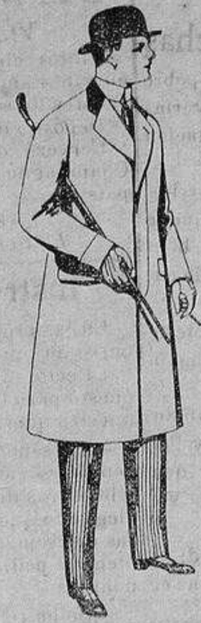
Gabanes de patén, meltón y cheviot, con forros seda, sastrakán o escocés. De ptas. 33 a 110