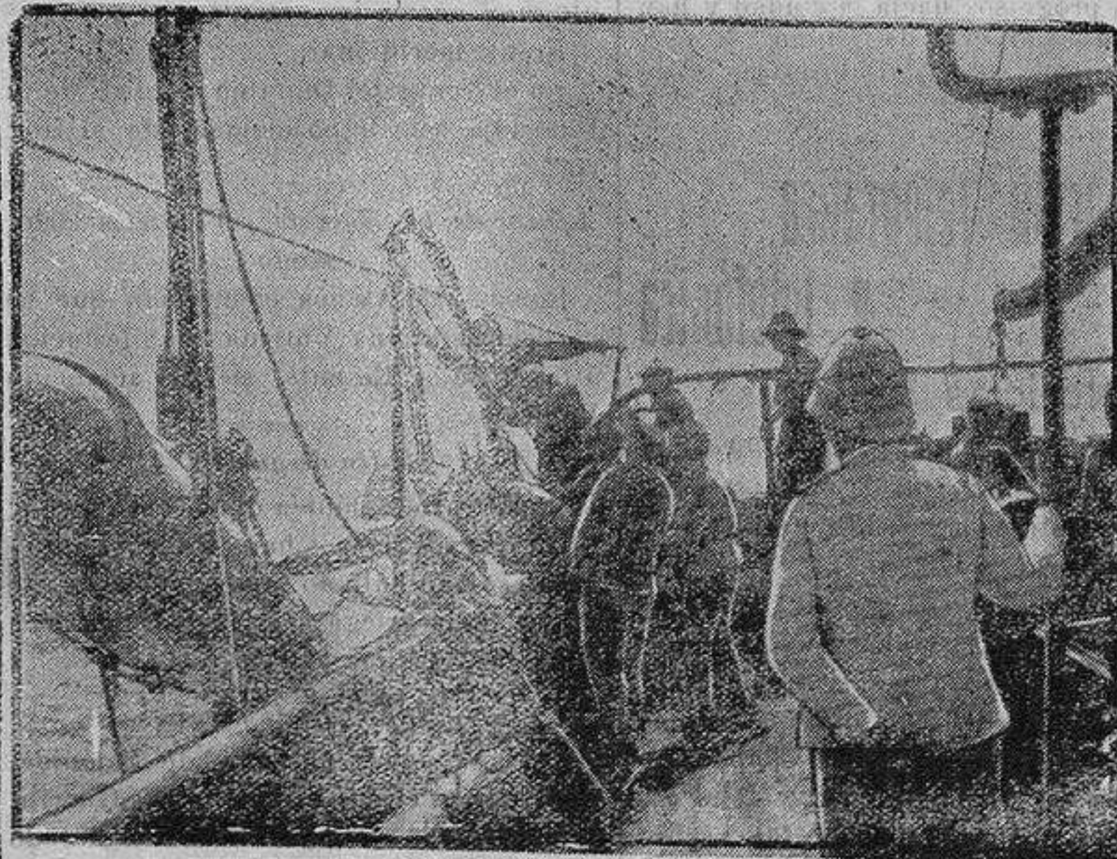
DRAGADO DE MINAS EN EL MEDITERRANEO