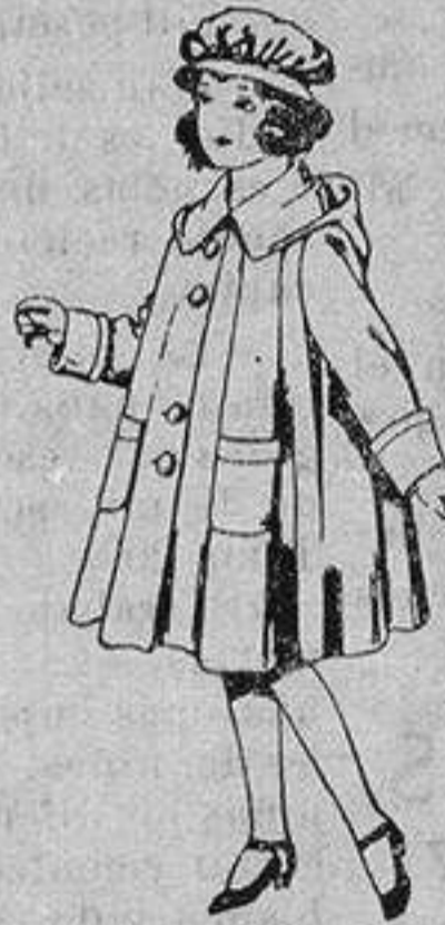
Abrigos de gabarrina impermeabilizada para niñas de 4 a 12 años. De ptas. 40 a 70